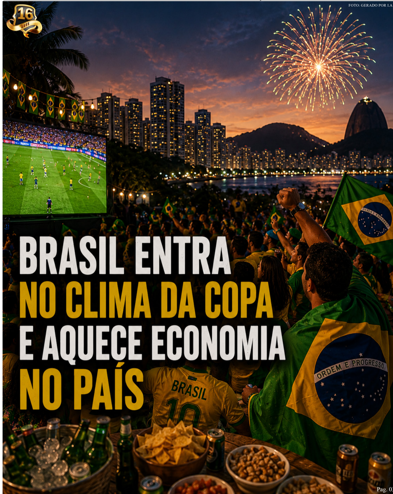
FOTO: GERADO POR IA