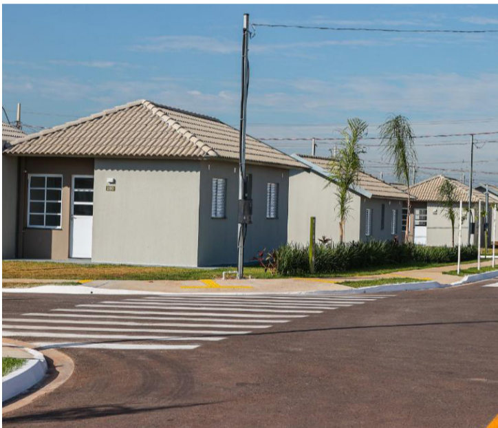
COM ISSO, O PROGRAMA SE CONSOLIDA COMO UMA DAS PRINCIPAIS FRENTE DE INVESTIMENTO PÚBLICO

O Governo de Mato Grosso, sob a gestão do governador Otaviano Pivetta, consolidou nos últimos anos uma das maiores políticas habitacionais da história do estado, com foco na ampliação do acesso à moradia digna e na redução do déficit habitacional. A estratégia estadual é baseada em planejamento fiscal, parcerias institucionais e integração com programas federais, o que tem permitido a execução de empreendimentos em diversas regiões e para diferentes faixas de renda.