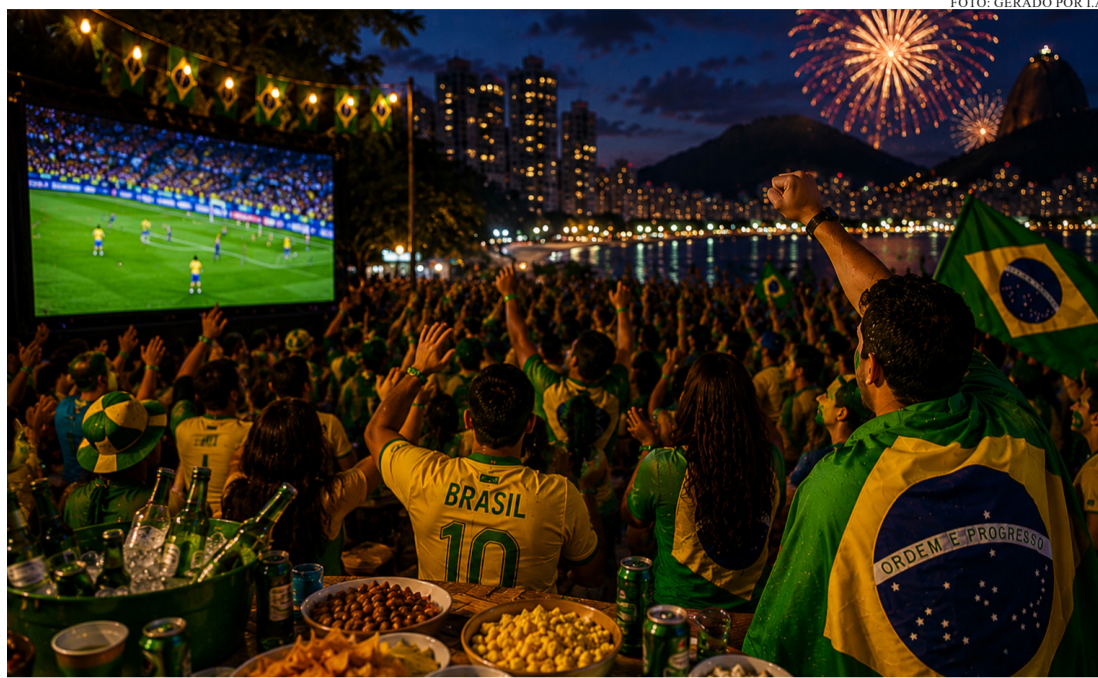
FOGOS, BANDEIRAS, TORCIDA E AQUELA ENERGIA QUE SÓ O BRASILEIRO SABE CRIAR.

Levantamentos do setor apontam que grandes eventos esportivos costumam gerar aumento nas vendas e estimular hábitos de consumo ligados ao lazer e entretenimento.