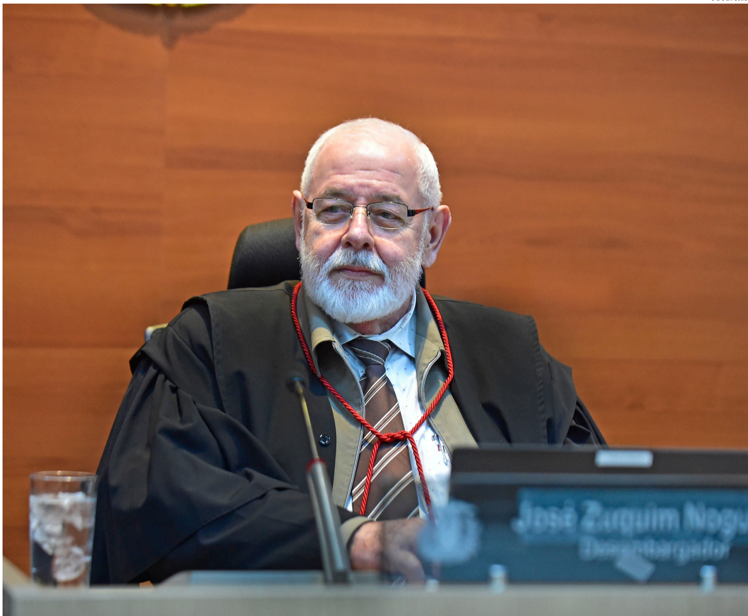
O POSTO FOI FRUTO DE SUCESSIVAS GESTÕES, UMA VEZ QUE 14 ANOS ANTES