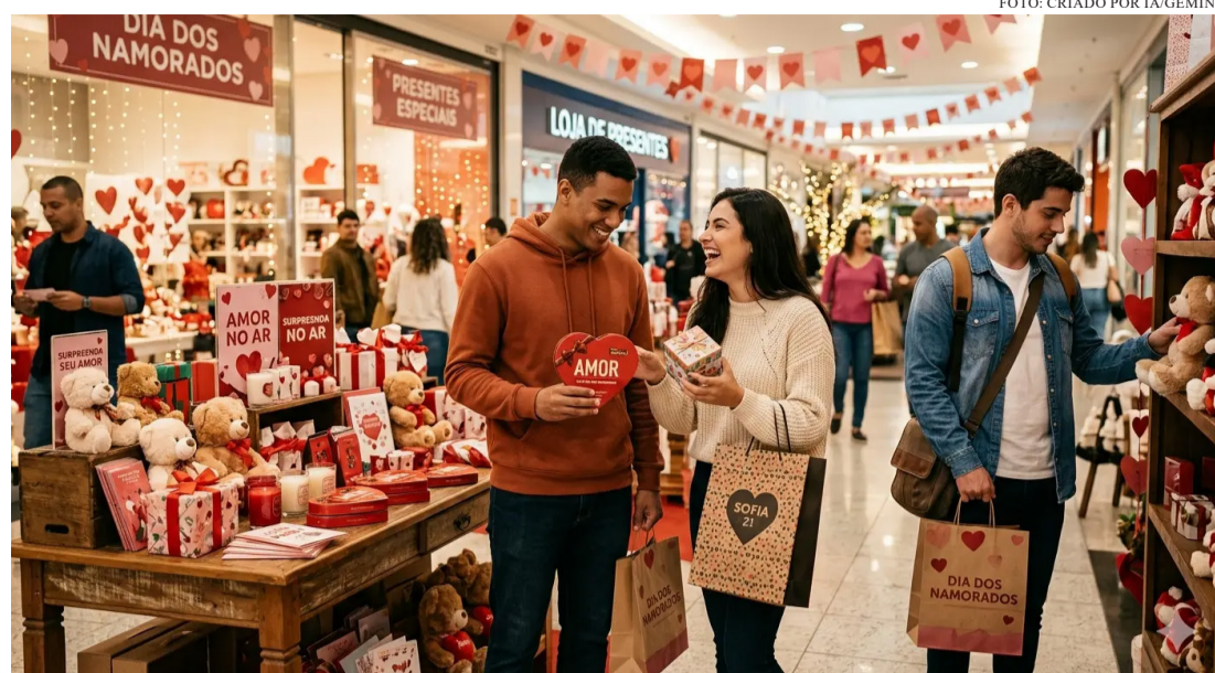
MUITOS EMPRESÁRIOS INVESTIRAM EM DECORAÇÃO TEMÁTICA

Os segmentos de vestuário, calçados, acessórios,