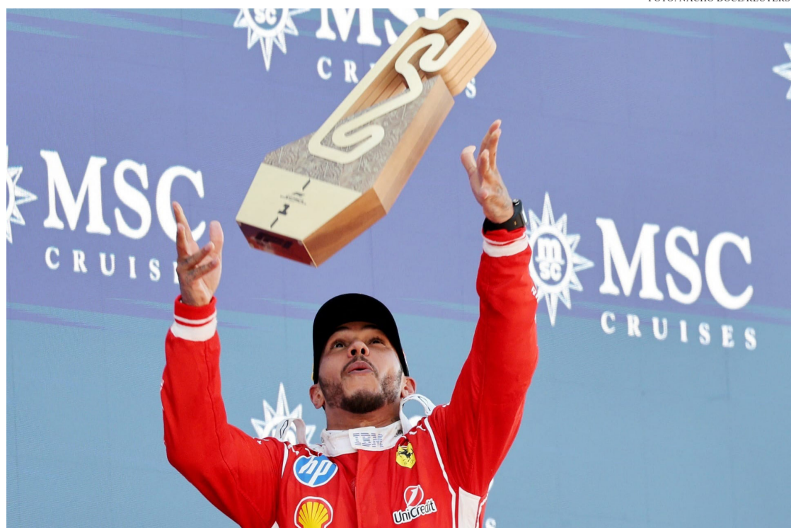
COM ESSA VITÓRIA, ANTONELLI CRAVA CINCO VITÓRIAS SEGUIDAS.

Espera de Lewis Hamilton meira vez desde a ca - com as cores da o GP da Bélgica b o u . Ferrari. O hepta- de 2024, quando Depois de meses campeão venceu o ainda defendia a de adaptação, dú- Grande Prêmio de Mercedes. O triun- vidas e muita ex- Barcelona, sétima fo também entrou pectativa no pad- etapa da tempora- para a história do dock, a Fórmula 1 da 2026, e voltou britânico. Foi a finalmente assistiu ao lugar mais alto 106ª vitória da car- à primeira vitória do pódio pela pri- reira na Fórmula 1