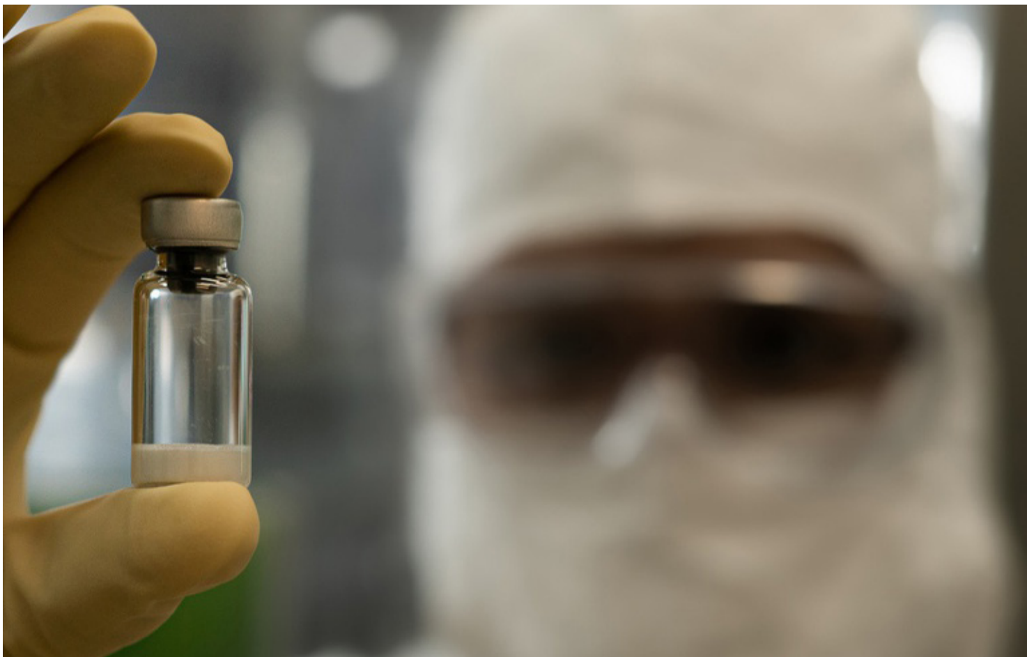
CERCA DE 98,9% DOS PARTICIPANTES DESENVOLVERAM ANTICORPOS NEUTRALIZANTES CONTRA O VÍRUS DA CHIKUNGUNYA.

Segundo o instituto, a mudança representa um avanço importante na autonomia do país na produção de imunizantes. O diretor do Butantan, Esper Kallás, destacou que a produção em uma instituição