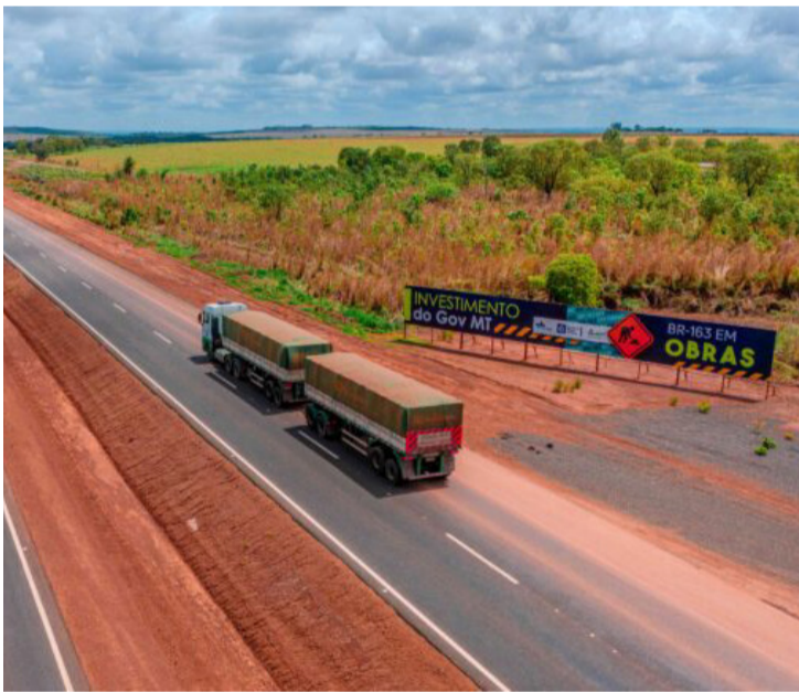
O TRECHO ENTRE CUIABÁ E ROSÁRIO OESTE É O MAIS COMPLEXO DO CRONOGRAMA

As obras de duplicação da BR-163 em Mato Grosso seguem em ritmo contínuo e registram avanços importantes ao longo do principal corredor logístico que conecta o norte do Estado à capital Cuiabá. A rodovia, essencial para o escoamento da produção agrícola e integração regional, passa por um processo de modernização conduzido pelo governo estadual, com foco na ampliação da capacidade de tráfego, segurança viária e melhoria da infraestrutura.