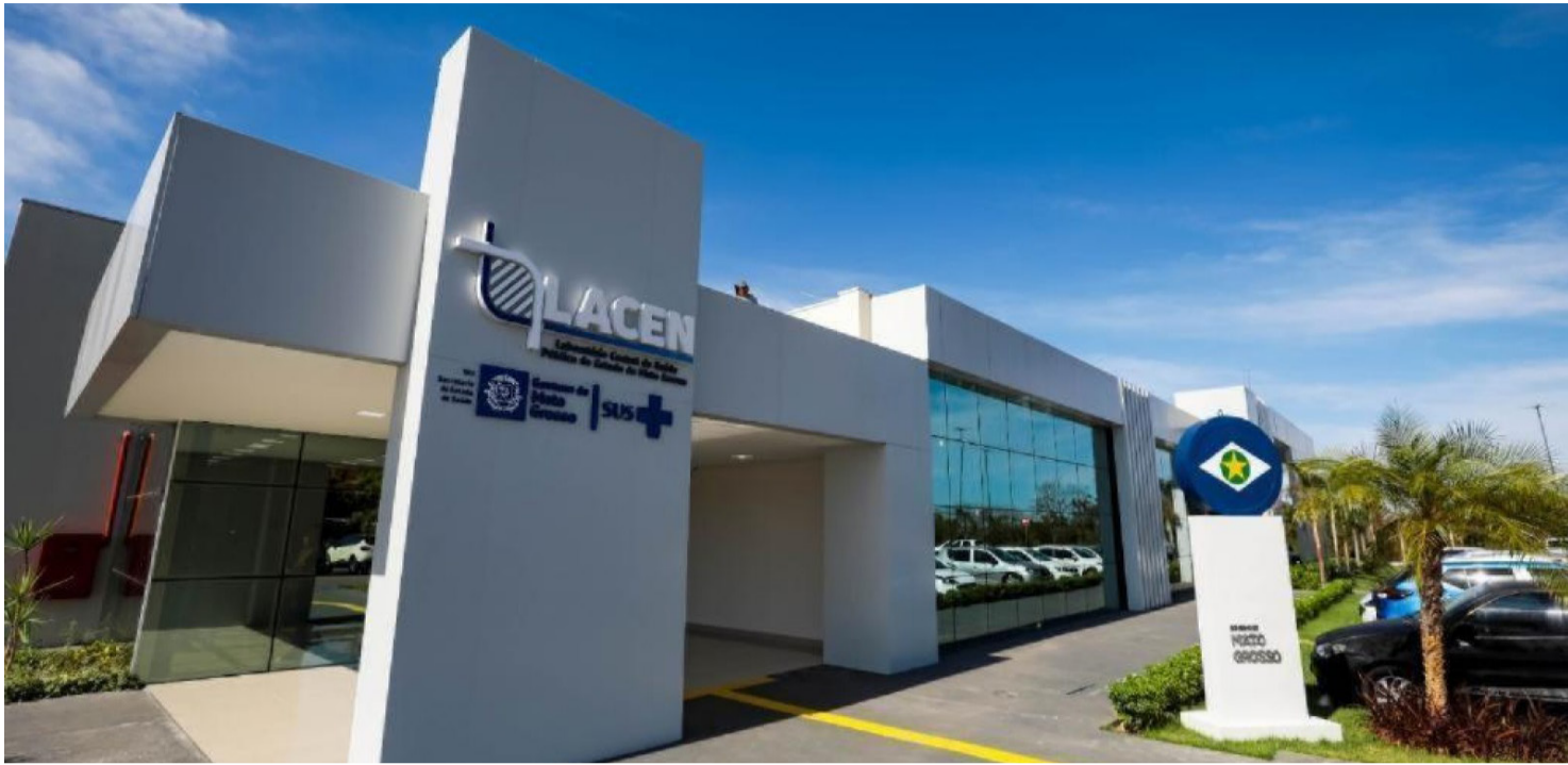
A PREVENÇÃO É BASEADA NA VACINAÇÃO, DISPONÍVEL NO SUS

Segundo a gestão estadual, os investimentos realizados no laboratório fortalecem a capacidade