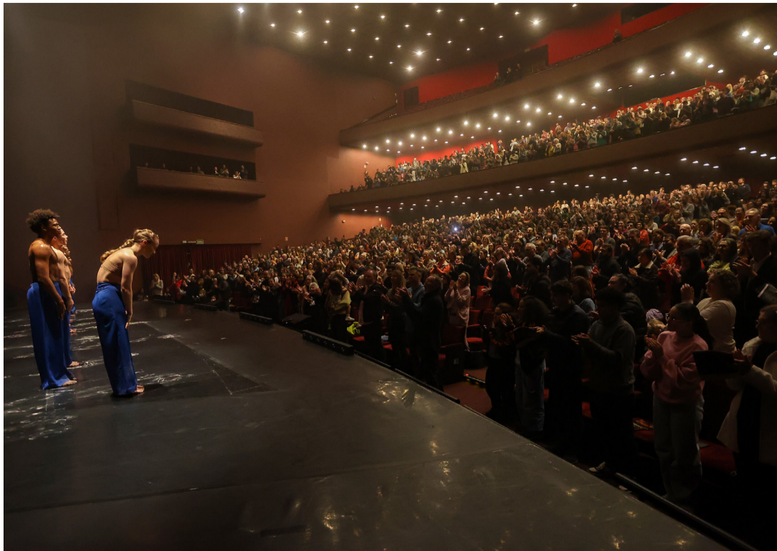
NA PRÁTICA, O IMPACTO VAI ALÉM DO ESPETÁCULO.

ocorre por diferentes caminhos. Entre os principais fatores estão a geração de empregos diretos e indiretos, a movimentação do turismo, o consumo em cadeia (envolvendo hotéis, restaurantes, transporte e comércio) e a arrecadação de impostos, como ISS e ICMS. Trata-se de um ci-