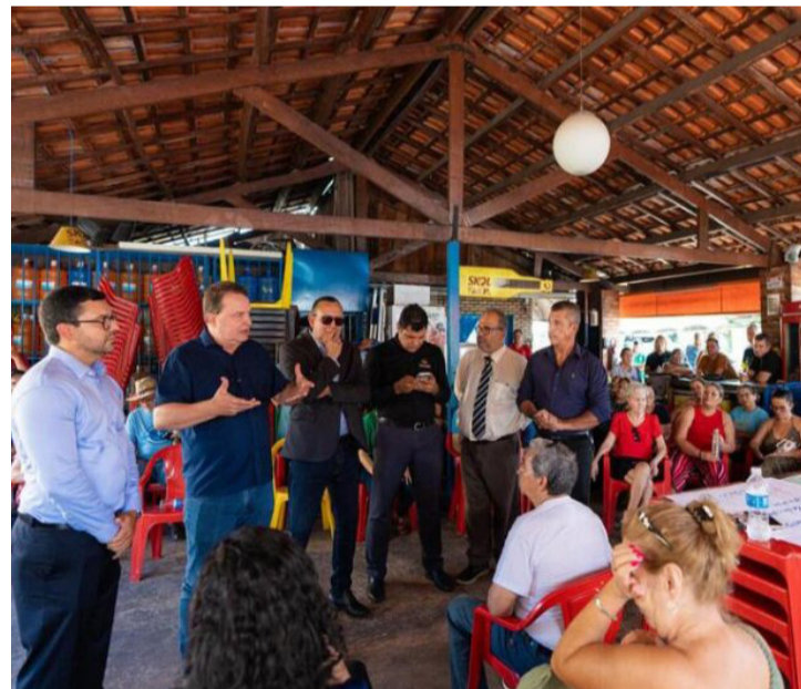
ESSE TIPO DE CENÁRIO EVIDENCIA FRAGILIDADES HISTÓRICAS NA REGULARIZAÇÃO FUNDIÁRIA

A crescente complexidade dos conflitos fundiários urbanos em Cuiabá revela um dos principais desafios estruturais das cidades brasileiras: equilibrar o direito à moradia com a segurança jurídica em áreas marcadas por disputas antigas. Nesse contexto, a atuação do presidente da Assembleia Legislativa de Mato Grosso, Max Russi, ganha relevância ao conduzir uma resposta institucional voltada à mediação e à construção de soluções duradouras.