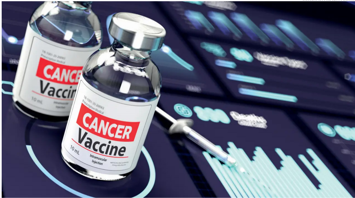
O TRATAMENTO DO CÂNCER ESTEVE FUNDAMENTADO EM PROCEDIMENTOS COMO CIRURGIA, QUIMIOTERAPIA E RADIOTERAPIA.

Ao longo da história, o tratamento do câncer esteve