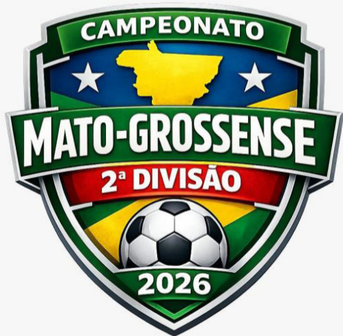
A NOVA EDIÇÃO SUCEDE A CONQUISTA DO CHAPADA, CAMPEÃO DA TEMPORADA 2025

A 2ª Divisão do Campeonato Mato-grossense teve início neste sábado (18/04), reunindo dez equipes na disputa por duas vagas na elite do futebol estadual em 2027. A fase eliminatória