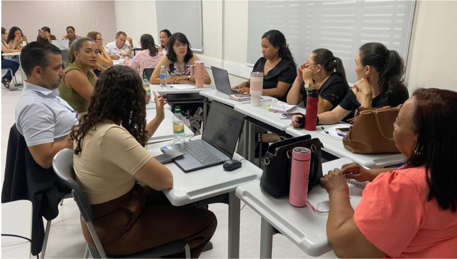
ESSE PROCESSO CONTRIBUI DIRETAMENTE PARA O PLANEJAMENTO DE ESTRATÉGIAS MAIS ASSERTIVAS

O conteúdo programático contempla aspectos teóricos e práticos, proporcionando aos participantes uma compreensão ampliada sobre o papel da comunicação em saúde como instrumento essencial na prevenção, no diagnóstico precoce e na adesão ao tratamento da tuberculose. Nesse contexto, são adotadas metodologias participativas, como rodas de conversa, estudos de caso, oficinas práticas e atividades colaborativas, que incentivam a troca de