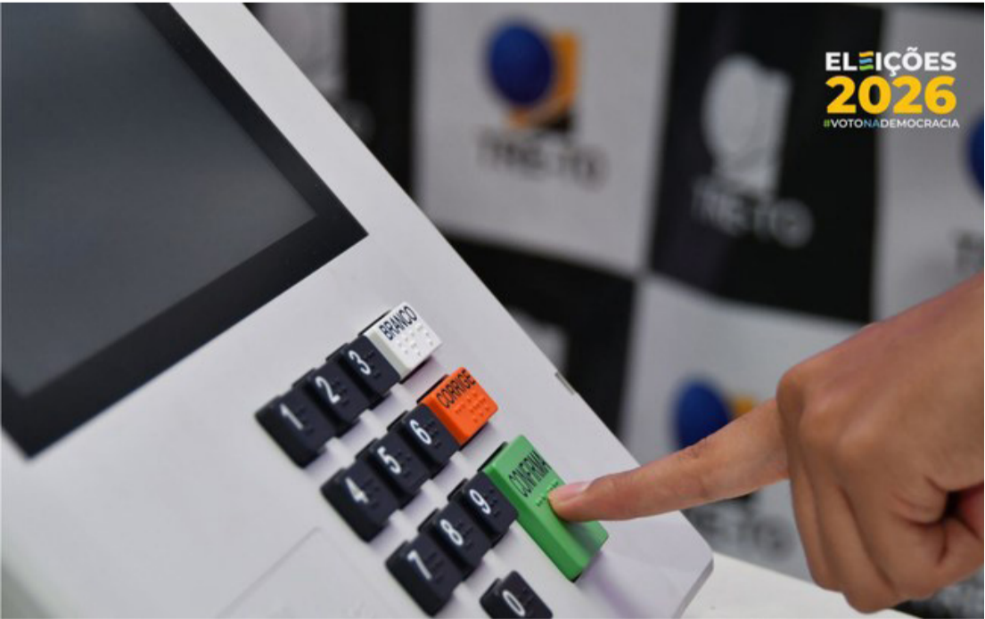
APÓS A VOTAÇÃO E EVENTUAL SEGUNDO TURNO, OS ELEITOS SERÃO DIPLOMADOS ATÉ 19 DE DEZEMBRO

O processo eleitoral de 2026 avança para fases decisivas que antecedem a votação em todo o país, prevista para outubro. Os eleitores brasileiros irão às urnas para escolher presidente da República, governadores, senadores,