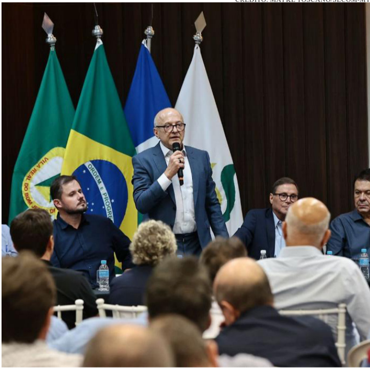
O ANÚNCIO FOI REALIZADO DURANTE SEMINÁRIO PROMOVIDO PELA APROSOJA

O governador Otaviano Pivetta anunciou a manutenção do congelamento dos valores do Fundo Estadual de Transporte e Habitação (Fethab) até o final de 2026, bem como o encerramento, a partir de 2027, da cobrança adicional conhecida como Fethab 2. As medidas, que serão encaminhadas para apreciação da Assembleia Legislativa, integram a estratégia do governo de Mato Grosso voltada à responsabilidade fiscal, ao equilíbrio das contas públicas e ao fortalecimento do setor produtivo.