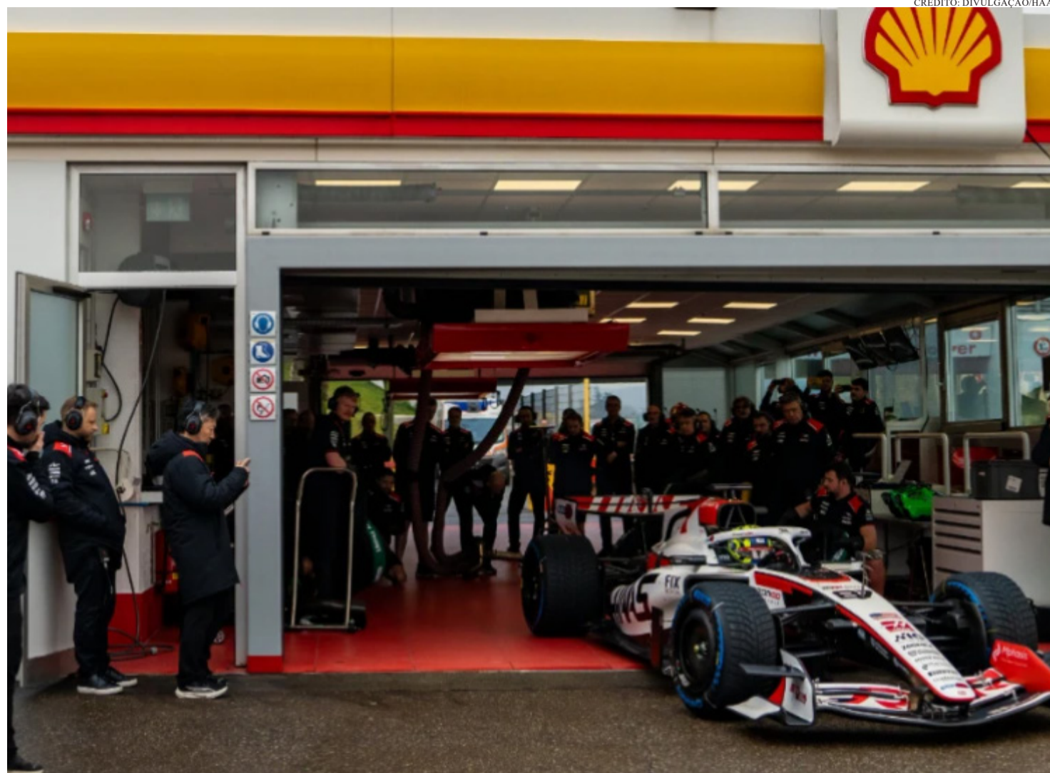
A CATEGORIA TEVE OS GRANDES PRÊMIOS DO BAHREIN E DA ARÁBIA SAUDITA CANCELADOS EM MEIO À CRESCENTE TENSÃO NO ORIENTE MÉDIO

O retorno já tem endereço e data marcada: o Grande Prêmio de Miami, entre os dias 1º e 3 de maio, no Autódromo