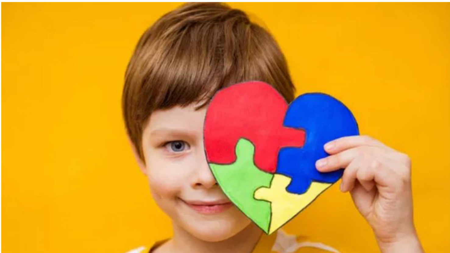
NEUROLOGISTAS E NEUROPEDIATRAS CONCENTRAM A MAIOR PARTE DOS DIAGNÓSTICOS

cenário também é preocupante. Somente 15,5% dos entrevistados utilizam exclusivamente a rede pública, enquanto mais de 60% recorrem a atendimentos particulares ou convênios. Além disso, a carga horária semanal de terapias é considerada insuficiente: a maioria realiza até duas horas por semana, número abaixo do recomendado interna-