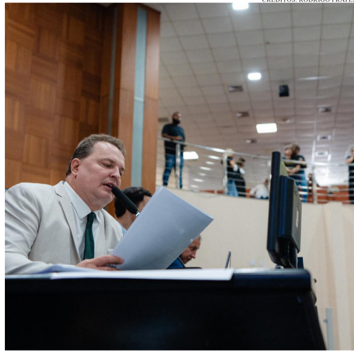
A ALTERAÇÃO NÃO IMPLICA MUDANÇA DE NÍVEL OU CLASSE DOS SERVIDORES

A Assembleia Legislativa de Mato Grosso (ALMT) aprovou a Proposta de Emenda à Constituição (PEC) que transforma o cargo de Assistente Penitenciário em Policial Penal no Estado. A medida segue para promulgação e representa um avanço institucional na valorização dos servidores e no fortalecimento da segurança pública.