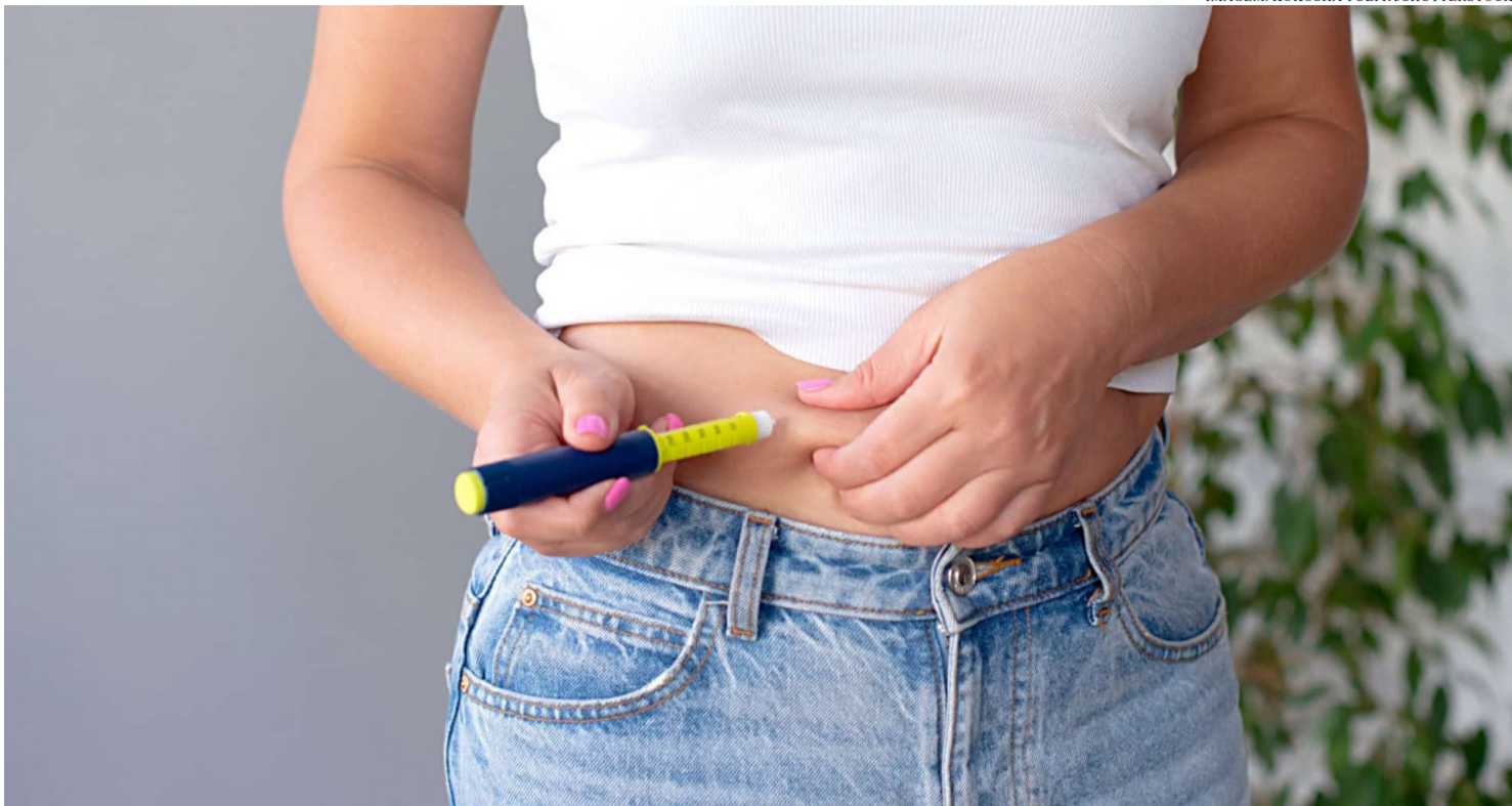
OS DADOS INDICAM NÃO APENAS A AMPLIAÇÃO DO CONSUMO, MAS TAMBÉM O FORTALECIMENTO DE CANAIS IRREGULARES DE DISTRIBUIÇÃO.

Os primeiros sinais mais consistentes surgiram entre 2018 e 2024, com base em registros do sistema Vigimed, utilizado para monitoramento de eventos adversos no país. Nesse período, foram notificadas milhares