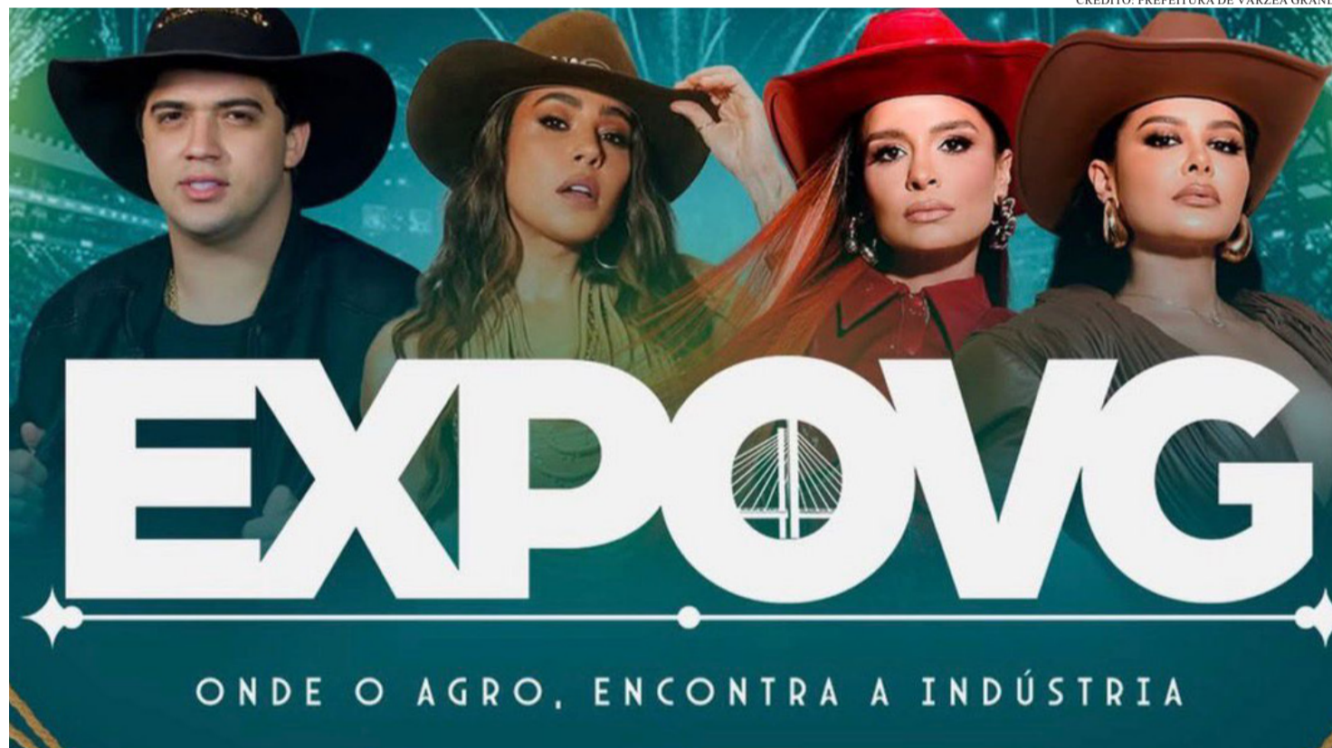
COM UMA PROPOSTA QUE UNE O ENTRETENIMENTO DE MASSA AO FOMENTO DO AGRONEGÓCIO E DA ECONOMIA CRIATIVA