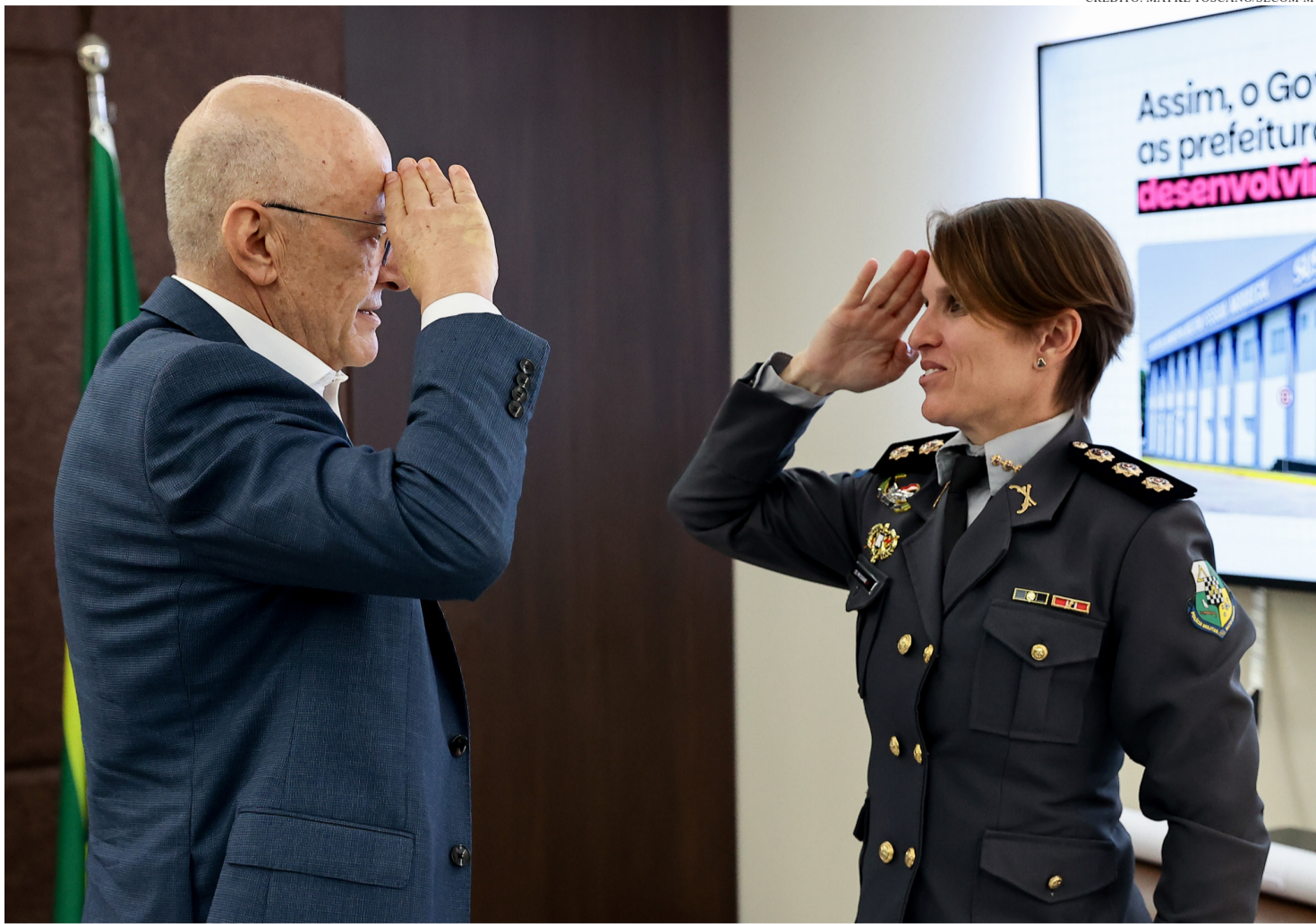
NO CENÁRIO NACIONAL, SUA TRAJETÓRIA REGISTRA UM FEITO INÉDITO

A formação acadêmica da nova secretária reforça um perfil multidisciplinar e alinhado às exigências contemporâneas da gestão pública. É bacharel em Segurança Pública, Educação Física e Di-