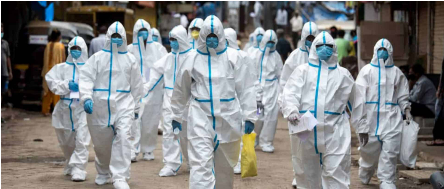
ESPECIALISTAS DEFENDEM O FORTALECIMENTO PERMANENTE DA VIGILÂNCIA EPIDEMIOLÓGICA

de organismos internacionais. Além do monitoramento clínico e epidemiológico, especialistas destacam que o vírus Nipah representa um exemplo claro dos riscos associados ao avanço sobre áreas naturais e à maior interação entre seres humanos, animais silvestre e rebanhos domésticos. O desmatamento, a expansão agrícola e a urbanização acelerada contribuem para a aproximação de morcegos frugívoros de zonas habitadas, aumentando a probabilidade de contaminação de alimentos e água. Esse contexto reforça a importância do conceito de “Uma Só Saúde”, que integra saúde humana, animal e ambiental na formulação de políticas públicas. A Organização Mundial da Saúde mantém o Nipah na lista de patógenos prioritários para pesquisa e desenvolvimento, justamente pelo potencial de causar surtos graves, pela ausência de terapias específicas e pela possibilidade, ainda que limitada, de transmissão entre pessoas. Estudos estão em andamento para o desenvolvimento de vacinas e antivirais, mas especialistas alertam que esses avanços exigem tempo, investimentos contínuos e cooperação internacional. Em regiões afetadas, as recomendações incluem evitar o consumo de frutas parcialmente comidas por morcegos, ferver água em áreas de risco, reforçar medidas de biossegurança em granjas e adotar protocolos rigorosos em unidades de saúde. A experiência acumulada em surtos anteriores mostrou que a comunicação clara com a população é um fator decisivo para conter a disseminação do vírus e reduzir mortes.