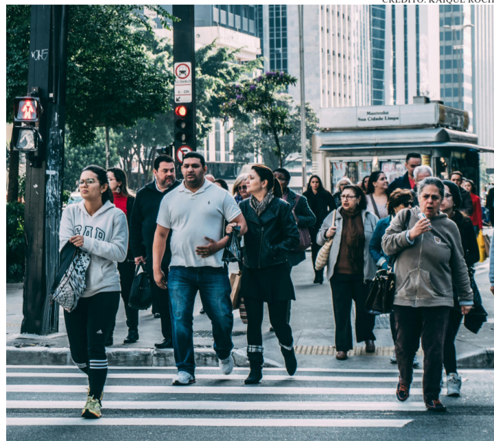
MEDICAMENTOS E PRODUTOS FARMACÊUTICOS SEGUEM COMO OS PRINCIPAIS ITENS IMPORTADOS DA UE

Os efeitos do acordo não se restringem aos grandes números do comércio exterior. No mercado interno, o consumidor brasileiro tende a perceber mudanças graduais nos próximos anos. A profes-