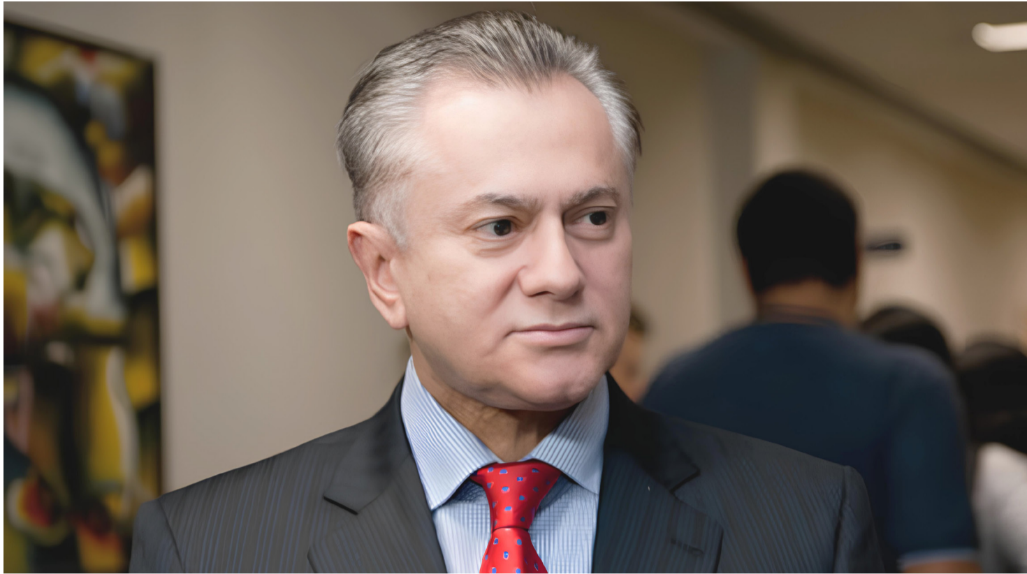
SUA BIOGRAFIA REFLETE NÃO APENAS A ASCENSÃO PESSOAL DE UM MAGISTRADO VOCACIONADO