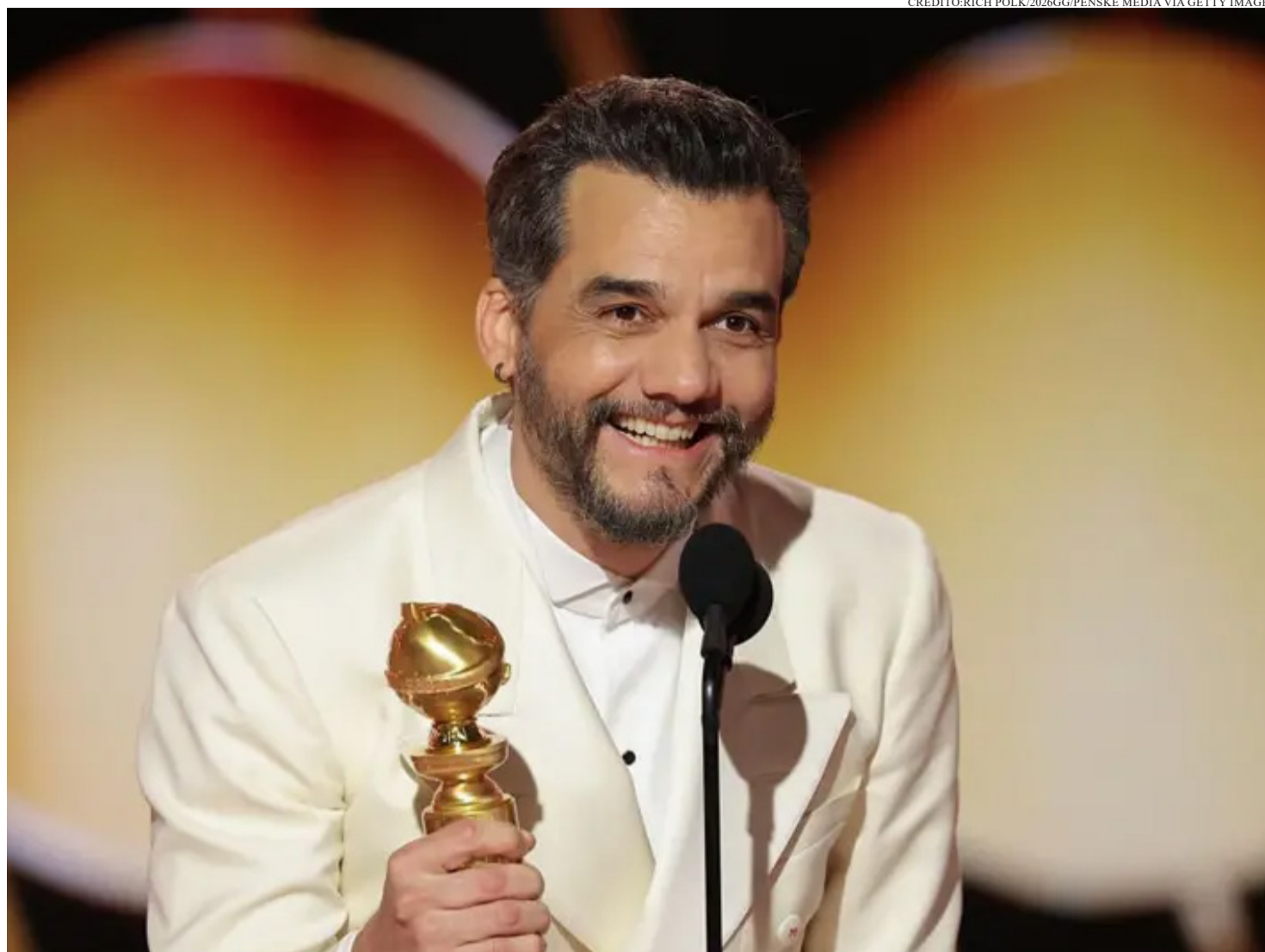
O ATOR WAGNER MOURA GANHOU O GLOBO DE OURO 2026 NA CATEGORIA MELHOR ATOR DE DRAMA POR SUA ATUAÇÃO EM O AGENTE SECRETO.

O discurso de que “o cinema nacional é ruim” é quase um mantra cultural no país. No entanto, é um argumento que raramente sobrevive a cinco minutos de conversa técnica. Enquanto o público médio brasileiro torce o nariz para as produções locais, rotulando elas injustamente em estereótipos de “só violência” ou “só comédia pastelão”, nossas obras