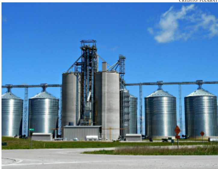
DE ACORDO COM A CNI, A MEDIDA AMPLIA DE FORMA SIGNIFICATIVA O ACESSO DO BRASIL AO COMÉRCIO GLOBAL

Do ponto de vista brasileiro, o acordo representa uma inflexão importante na inserção internacional do país. Um levantamento da Confederação Nacional da Indústria (CNI) aponta que mais de cinco mil produtos brasileiros terão imposto de importação zerado na União