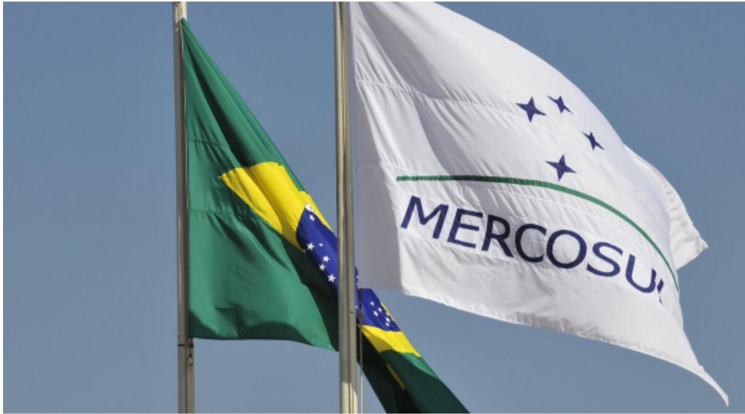
PARA O BRASIL E DE FORMA AINDA MAIS CONCRETA, PARA MATO GROSSO O ACORDO REPRESENTA UMA MUDANÇA ESTRUTURAL NO PAPEL DO PAÍS NO COMÉRCIO INTERNACIONAL

Realizada em janeiro deste ano, simboliza uma resposta estratégica a um mundo em transformação. Desde a década de 1990, quando os Estados Unidos consolidaram sua posição como potência hegemônica em um sistema unipolar e passaram a defender iniciativas como a Área de Livre Comércio das Américas (ALCA), países da América do Sul e da Europa buscaram alternativas para reduzir dependências, diversificar mercados e preservar influência geopolítica. Foi nesse contexto que Mercosul e União Europeia iniciaram negociações que atravessariam décadas, marcadas por avanços pontuais, recuos frequentes e impasses políticos internos. Ao longo desse período, a própria dinâmica do sistema internacional mudou de