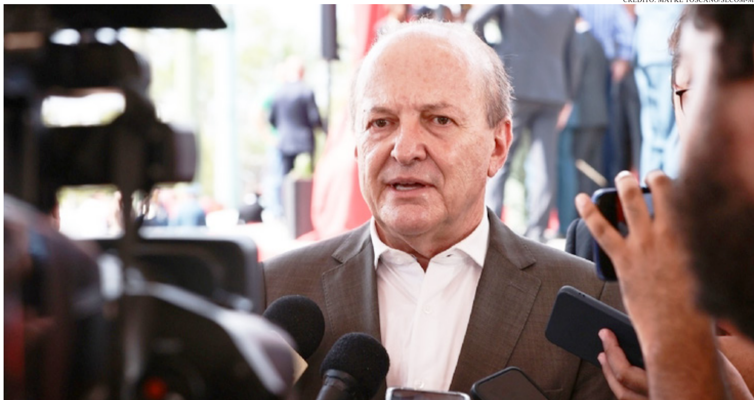
O VICE-GOVERNADOR, JÁ SE COLOCA COMO PRÉ-CANDIDATO À REELEIÇÃO

O vice-governador Otaviano Pivetta (Republicanos) afirmou que não pretende promover mudanças significativas no secretariado do Governo do Estado caso assuma a chefia do Executivo. A sinalização é de continuidade administrativa, mesmo diante da possibilidade de o governador Mauro Mendes (União) deixar o cargo para disputar uma vaga no Senado. Segundo Pivetta, a diretriz é preservar a equipe montada ao longo da atual gestão, realizando apenas ajustes pontuais motivados por afastamentos obrigatórios de secretários que devem disputar as eleições. Durante pronunciamento na Assembleia Legislativa, Pivetta reforçou que se sente preparado para conduzir o governo, mas fez questão de destacar que o projeto político e administrativo