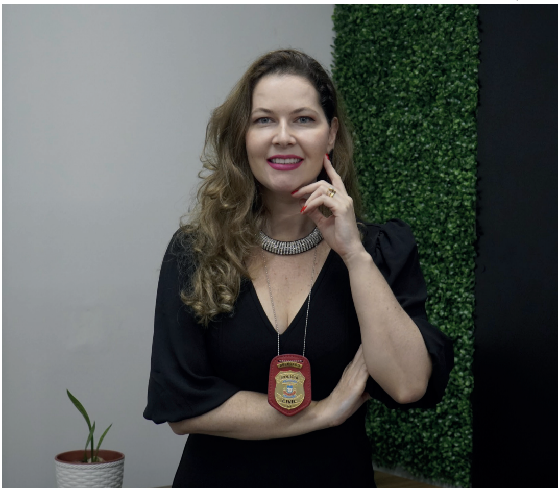
SUA VIVÊNCIA PROFISSIONAL TEVE INÍCIO COM ATUAÇÕES NO MINISTÉRIO PÚBLICO DO ESTADO DE MATO GROSSO.

Dando continuidade ao seu percurso acadêmico,