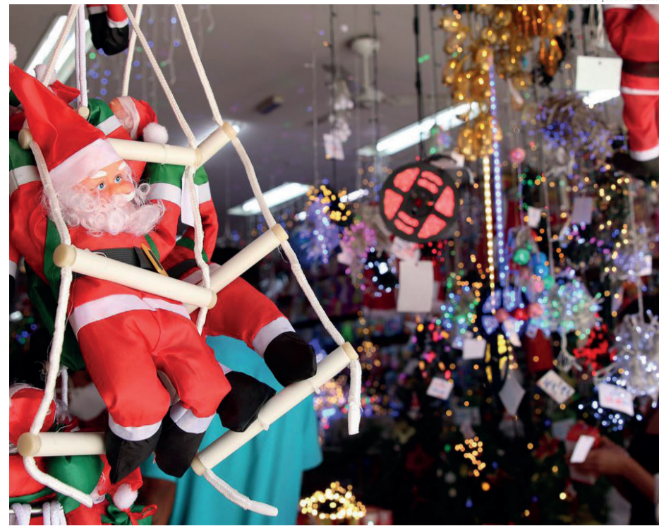
NATAL OTIMISTA: VENDAS DEVEM CRESCER NO VAREJO FÍSICO E DIGITAL.

Mesmo com desafios como inflação, endividamento das famílias e oscilações na confiança do consumidor, especialistas afirmam que o Natal mantém o papel de estabilizador do comércio. A tradição de presentear e reunir a família cria um ciclo de consumo que atinge praticamente todos os setores e gera efeitos duradouros. O período movimentada cadeias produtivas, estimula contratações temporárias e reforça a importância econômica das festas de fim de ano no país.