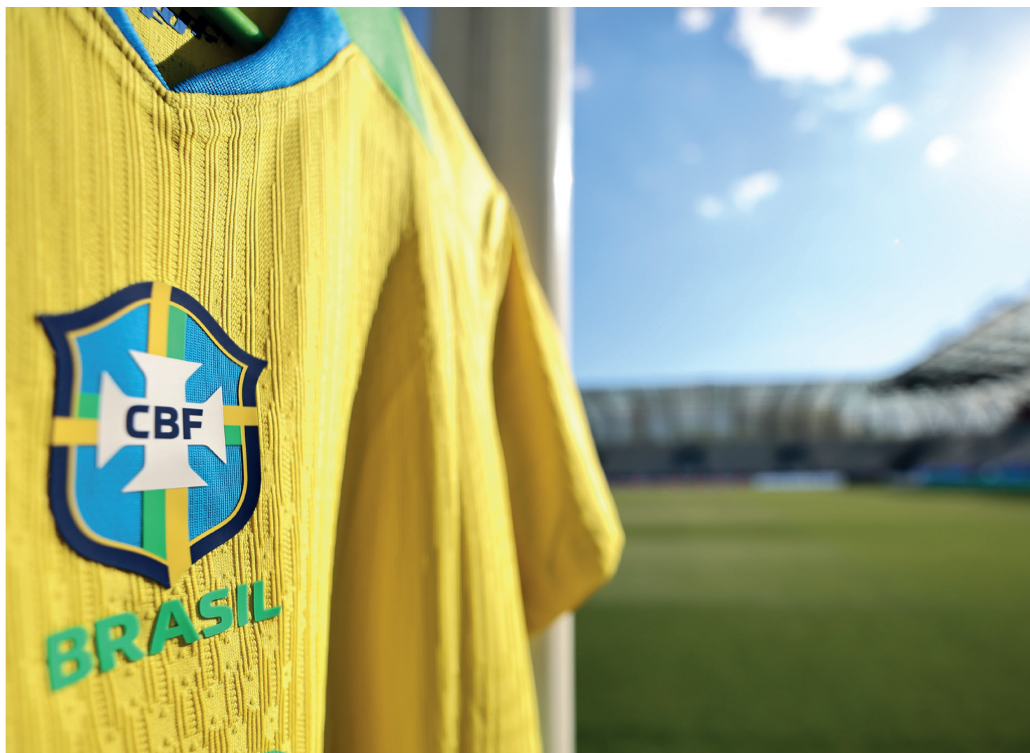
A MARCA DO BRASIL NÃO É SÓ FUTEBOL: É CULTURA, MÚSICA E IDENTIDADE.

E não por acaso. A FIFA, segundo analistas, ficou impressionada com a performance recente dos clubes brasileiros no Mundial de Clubes. Nosso futebol, por décadas conhecido por talento bruto e imprevisibilidade, parece estar conquistando espaço no tabuleiro global. Mas nem tudo é glória. Apesar desse momento de brilho, levantar