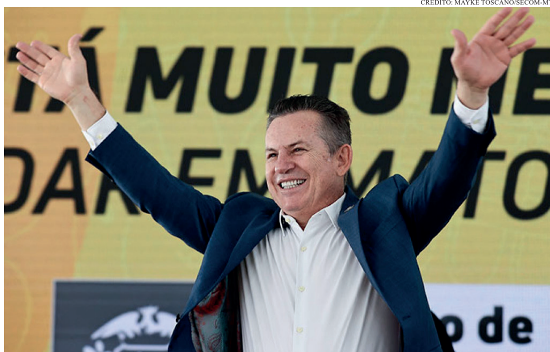
GOVERNADOR REVELA ESTUDO PARA TRAZER VOOS INTERNACIONAIS NA CAPITAL.

O governador Mauro Mendes afirmou que Mato Grosso estuda criar um programa de subvenção financeira para atrair voos internacionais e abrir de vez as portas do Estado ao turismo global. A ideia, segundo ele, é reduzir custos operacionais de companhias aéreas e consolidar uma rota que aproveite o potencial turístico local, ainda pouco explorado diante da demanda mundial por destinos de natureza. A declaração foi feita durante a posse da nova diretoria do Sindicato de Hotéis, Restaurantes, Bares e Similares de Mato Grosso, evento que reuniu empresários e lideranças políticas do setor. Mauro destacou que a iniciativa é vista como uma estratégia para formar uma cadeia internacional de turismo que conecte o Estado a novos mercados emissores. Em sua avaliação, Mato Grosso já possui uma grande indústria