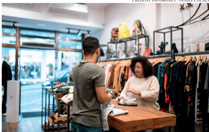
BLACK FRIDAY E NATAL ABREM VAGAS DE TRABALHO TEMPORÁRIAS E AQUECE ECONOMIA LOCAL.

A geração de empregos temporários e de renda extra ganha força no período natalino, que vai muito além das vitrines enfeitadas e do aumento natural nas vendas. A data se destaca como a principal responsável pela abertura de vagas temporárias em todo o país, fortalecendo o mercado de trabalho e oferecendo oportunidades para jovens, adultos e pessoas que buscam ampliar a renda em um momento de grande movimentação. Lojas, supermercados, empresas de logística, plataformas digitais e serviços de entrega reforçam equipes para atender a demanda acelerada que cresce conforme dezembro avança e o consumo aumenta. Esse movimento se intensifica com o avanço das compras digitais, que exige mais profissionais nos centros de distribuição, no atendimento ao