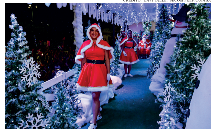
NATAL MOVIMENTA TURISMO, FORTALECE PEQUENOS NEGÓCIOS E IMPULSIONA A ECONOMIA.

O Natal transforma o cenário urbano e impulsiona o turismo em várias regiões, movimentando espaços públicos e reforçando a economia local. Cidades que investem em decoração temática atraem visitantes de estados vizinhos e aquecem bares, restaurantes, hotéis e centros culturais. A criação de vilas natalinas, apresentações musicais, desfiles iluminados e eventos gratuitos aumenta o fluxo de turistas e beneficia especialmente municípios que dependem do movimento sazonal para sustentar pequenos empreendedores que atuam em serviços, artesanato e gastronomia. O setor de alimentação está entre os mais favorecidos pelo período. Restaurantes ampliam cardápios especiais para atender confraternizações, buffets oferecem ceias personalizadas com foco em praticidade e supermercados