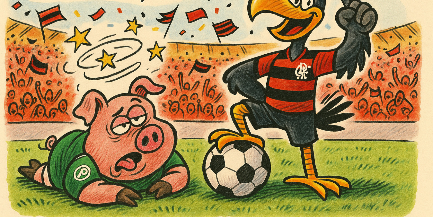
ILUSTRAÇÃO POR I.A.