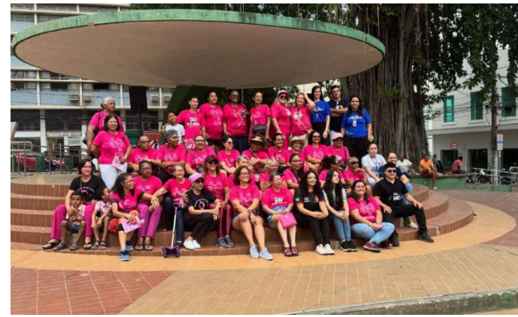
ATUALMENTE 129 MULHERES SÃO ASSISTIDAS PELA MTMAMMA

apoiando mulheres em tratamento e pós-tratamento do câncer de mama. Já as-