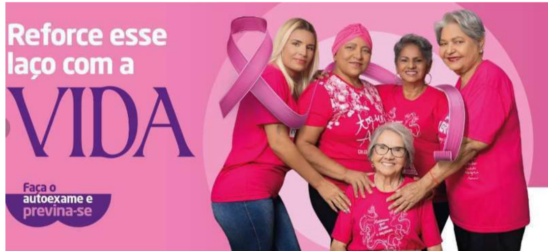
MTMAMMA REFORÇA A IMPORTÂNCIA DO DIAGNÓSTICO PRECOCE

A MTmamma-Amigos do Peito, Associação de Apoio a Pessoas com Câncer de Mama em Mato Grosso, promove a 16ª Campanha Outubro Rosa 2025, reforçando a importância do diagnóstico precoce. A entidade alerta para o papel de governos, gestores e sociedade no combate à doença, que é a maior causa de mortalidade feminina no Brasil, com 73.610 no-