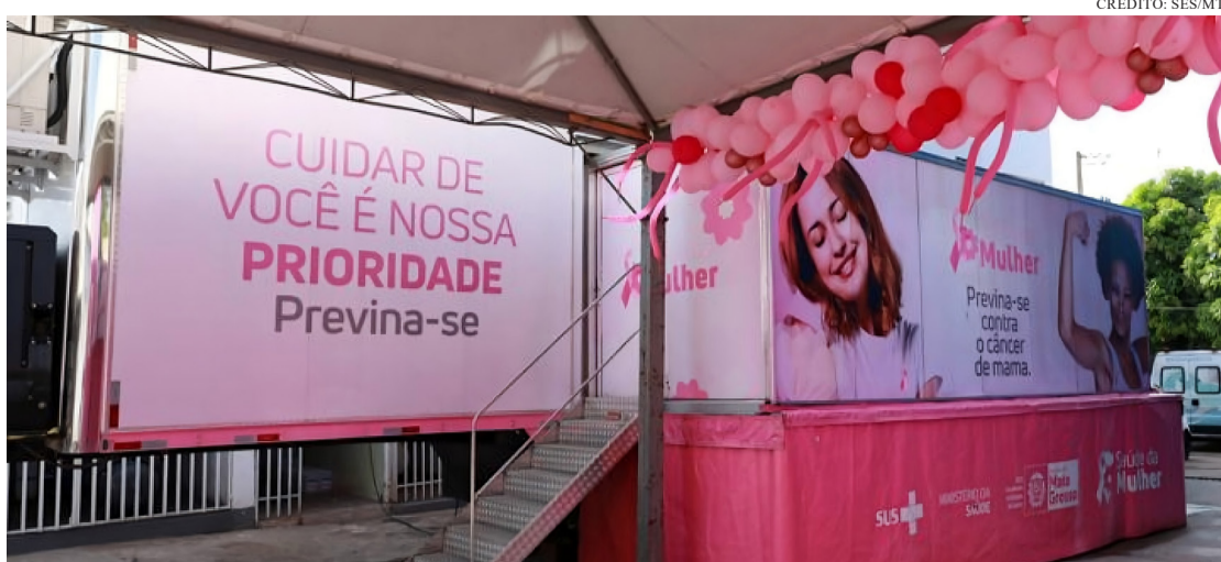
EM MATO GROSSO, A CAMPANHA DE 2025 DESTACOU-SE POR AÇÕES ENTRE SECRETARIA DE SAÚDE, PREFEITURAS, ONGS E O HOSPITAL DE CÂNCER

Em Mato Grosso, a campanha de 2025 destacou-se