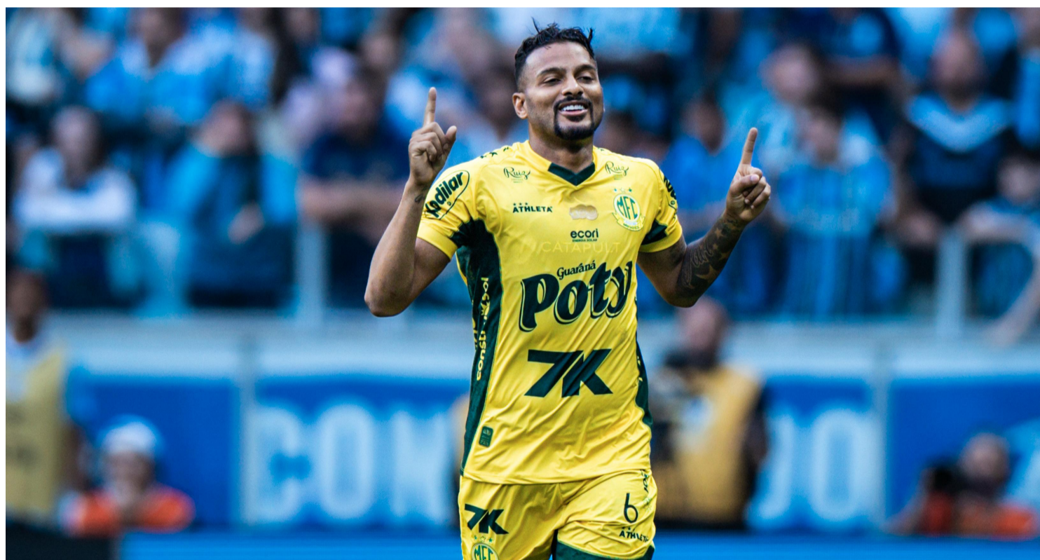
EM SEU PRIMEIRO ANO NA ELITE, O MIRASSOL É A GRANDE HISTÓRIA DO BRASILEIRÃO 2025