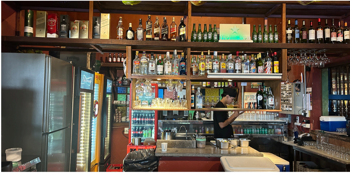
AUTORIDADES E O SETOR DE BARES E RESTAURANTES INTENSIFICAM A FISCALIZAÇÃO E A VIGILÂNCIA DA PROCEDÊNCIA DAS BEBIDAS PARA PROTEGER A SAÚDE PÚBLICA

O Brasil enfrenta uma crise de saúde pública em razão do consumo de bebidas alcoólicas adulteradas com metanol , substância química extremamente tóxica, capaz de causar cegueira irreversível e até a morte. Os dados oficiais demonstram a gravidade da situação: dezenas de casos de intoxicação já foram confirmados em diferentes estados, com mortes registradas e centenas de notificações em investigação. O metanol (CH 3 OH) , também conhecido como álcool metílico, é utilizado na indústria química para