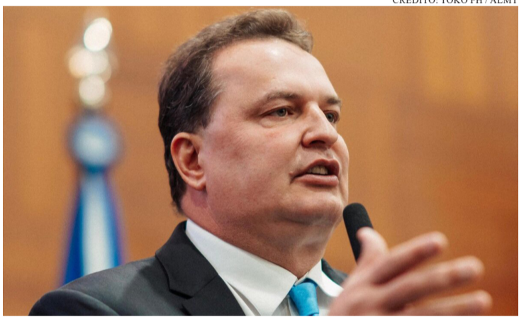
PARLAMENTAR DESTACA QUE NÚMEROS ALARMANTES EXIGEM UNIÃO DA SOCIEDADE E ATUAÇÃO FIRME DO PODER PÚBLICO