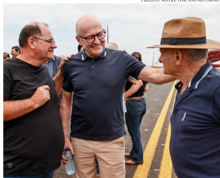
INVESTIMENTOS DO ESTADO MELHORAM A ROTINA DE FAMÍLIAS E EMPREENDEDORES DO CAMPO