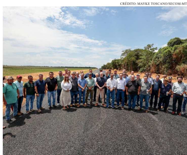
A LINHA CAPIXABA RECEBEU 8 KM DE ASFALTO NOVO E A LINHA SÃO PAULO SEGUE COM 39 KM EM OBRAS

O investimento em infraestrutura rodoviária contribui não apenas para a segurança e o conforto da população, mas também fortalece a atividade econômica local, promovendo o escoamento da produção agrícola e incentivando o desenvolvimento sustentável na região.