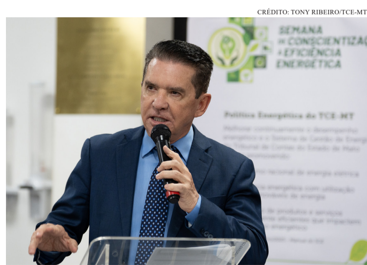
INICIATIVA INCENTIVA SERVIDORES A ADOTAREM ATITUDES SIMPLES PARA ECONOMIZAR ENERGIA E PRESERVAR O MEIO AMBIENTE

“Queremos zerar os nossos gastos com energia. Hoje, as placas solares instaladas suprem cer-