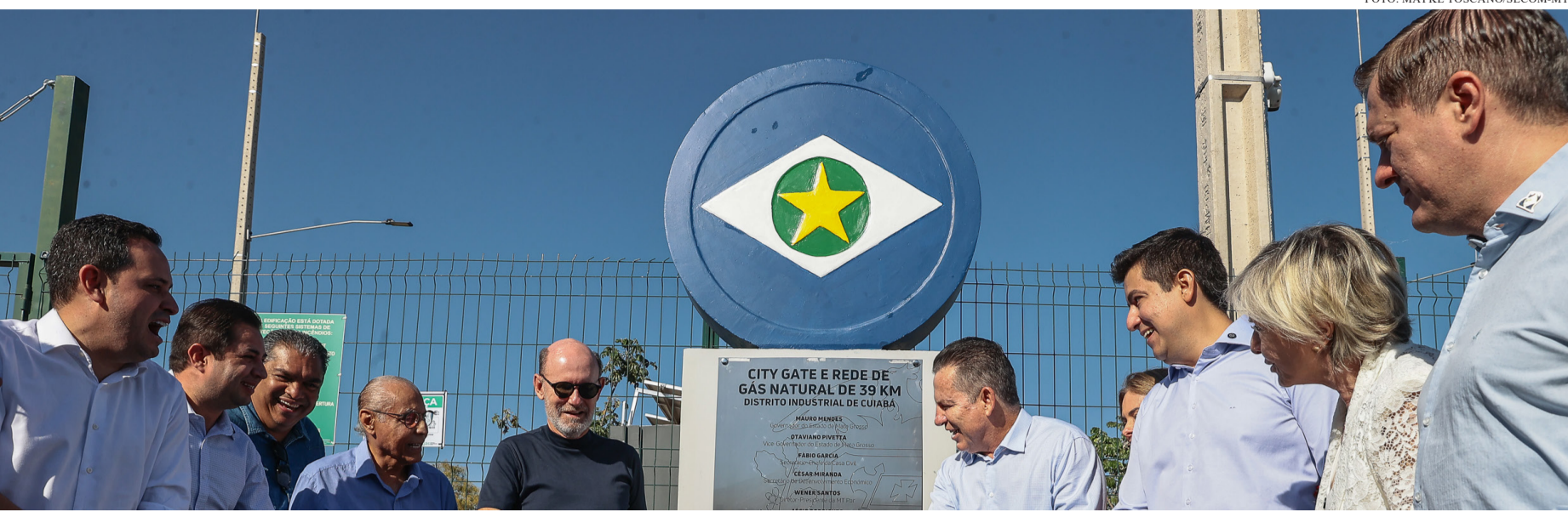
O SISTEMA SERÁ UM DIVISOR DE ÁGUAS NO PROCESSO DE INDUSTRIALIZAÇÃO DA CAPITAL DE MATO GROSSO

O Governo de Mato Grosso deu um passo histórico para a modernização da matriz energética do Estado com a entrega oficial do sistema de distribuição de gás natural canalizado no Distrito Industrial de Cuiabá. A obra, executada pela MT Gás, empresa pública vinculada ao Estado, rompe uma espera de mais de duas décadas e consolida o compromisso da atual gestão com a industrialização, geração de empregos e atração de investimentos.