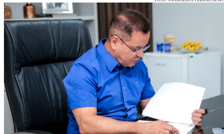
BOTELHO APOSTA NO CACAU E EM NOVAS CULTURAS PARA VALORIZAR PEQUENOS PRODUTORES

O deputado estadual Eduardo Botelho (União Brasil) reforça seu compromisso com a agricultura familiar, liderando ações para diversificar a produção e ampliar a renda dos pequenos produtores em Mato Grosso. Uma das iniciativas em destaque é a introdução do cultivo de cacau, que tem apresentado alto rendimento em outros estados e agora surge como uma alternativa promissora para o campo mato-grossense.