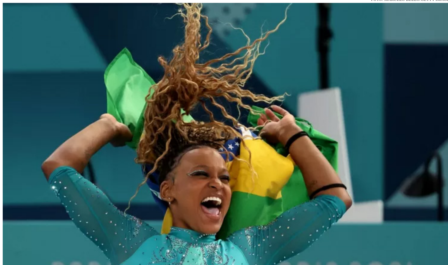
A VERDADE? A GENTE AMA O ESPETÁCULO, AS LÁGRIMAS, O DRAMA E A SUPERAÇÃO. MAIS QUE ISSO, A GENTE AMA GANHAR

Porque basta a chama olímpica se apagar, que essa paixão vai embora tão rápido quanto che-