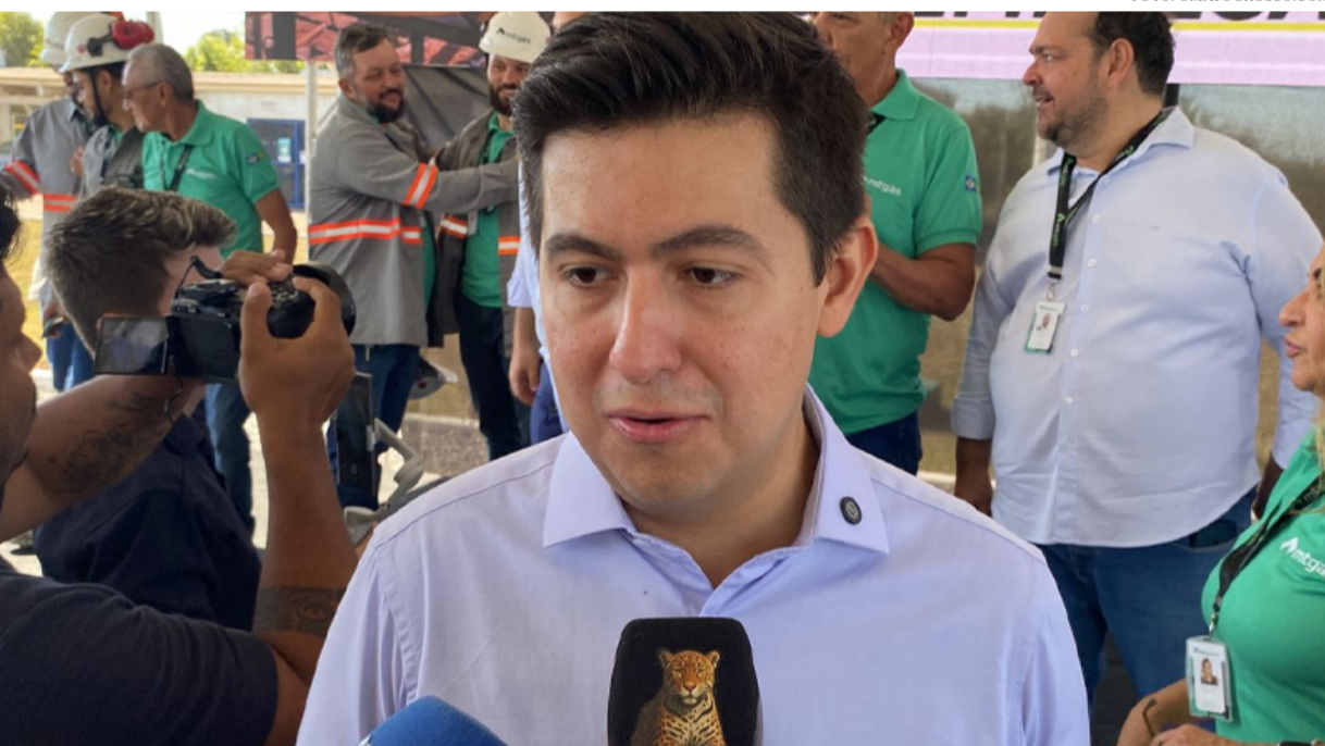
FRUTO DE UM INVESTIMENTO DE R$ 40 MILHÕES DO GOVERNO DO ESTADO, O GASODUTO FOI VIABILIZADO A PARTIR DE UM CONTRATO FIRME DE FORNECIMENTO COM A BOLÍVIA