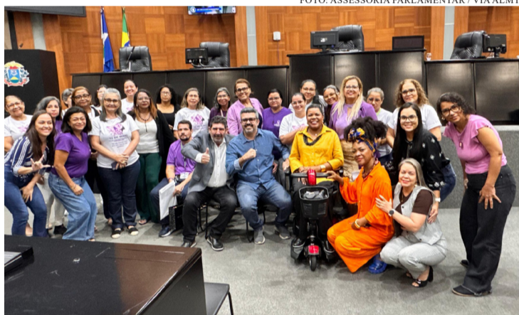
VITÓRIA COLETIVA COM FIBROMIALGIA RECONHECIDA COMO DEFICIÊNCIA

O reconhecimento da fibromialgia como deficiência (PcD), pela Lei Federal nº 14.705, marca um avanço na luta por dignidade e políticas públicas inclusivas. A medida amplia direitos, como isenção de IPI na compra de veículos, prioridade em atendimentos e acesso facilitado a concursos públicos.