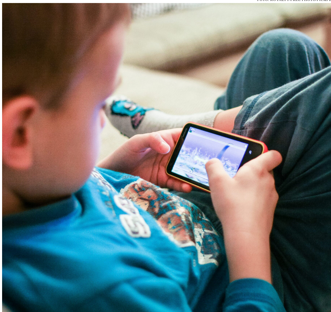
OMS ORIENTA QUE CRIANÇAS DE ATÉ 2 ANOS EVITEM QUALQUER CONTATO COM TELAS

No mundo moderno, telas como celulares, tablets, televisores e jogos digitais oferecem conteúdo atraente com a promessa de ajudar no processo educativo, mas seu uso inadequado pode ser extremamente prejudicial. Entre os prejuízos, destaca-se o impacto direto no desenvolvimento da fala e da linguagem, além de atrasos em outras habilidades essenciais para o crescimento saudável. Grande parte dos conhecimentos que moldam a criança ocorre até os dois anos de idade, quando ela