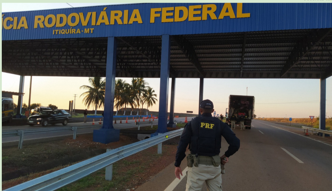
A MEDIDA TEM O OBJETIVO DE COIBIR O EXCESSO DE VELOCIDADE, UMA DAS PRINCIPAIS CAUSAS DE ACIDENTES GRAVES NAS ESTRADAS BRASILEIRAS.

A atuação da Polícia Rodoviária Federal (PRF) nas rodovias federais brasileiras vai muito além da simples fiscalização de veículos. Com presença permanente em pontos estratégicos do país, a instituição desempenha um papel essencial na garantia da segurança viária, no combate a irregularidades no trânsito e na preservação da vida nas estradas. Suas operações são desenvolvidas de forma rotineira e também em ações especiais, especialmente em períodos de maior fluxo, como feriados prolongados.