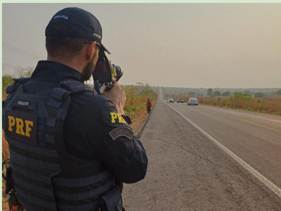
A POLÍCIA RODOVIÁRIA FEDERAL (PRF) ACREDITA QUE A SEGURANÇA NO TRÂNSITO SE CONSTRÓI TAMBÉM POR MEIO DA CONSCIENTIZAÇÃO