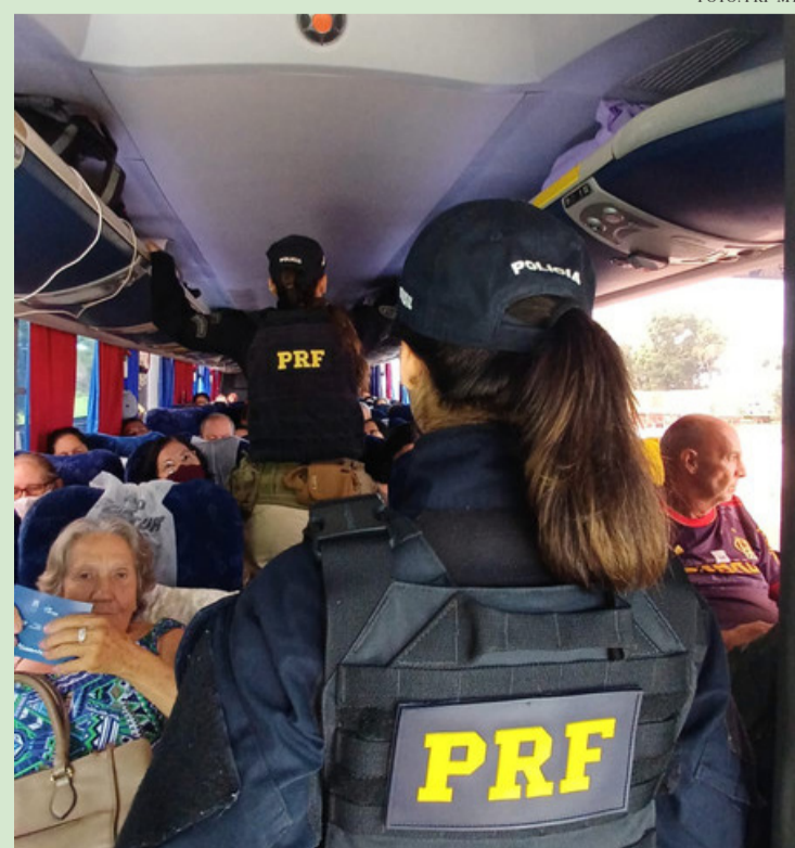
A INSTITUIÇÃO TAMBÉM PARTICIPA ATIVAMENTE DE CAMPANHAS NACIONAIS, COMO O MAIO AMARELO, QUE PROMOVE A CONSCIENTIZAÇÃO SOBRE A IMPORTÂNCIA DA SEGURANÇA VIÁRIA