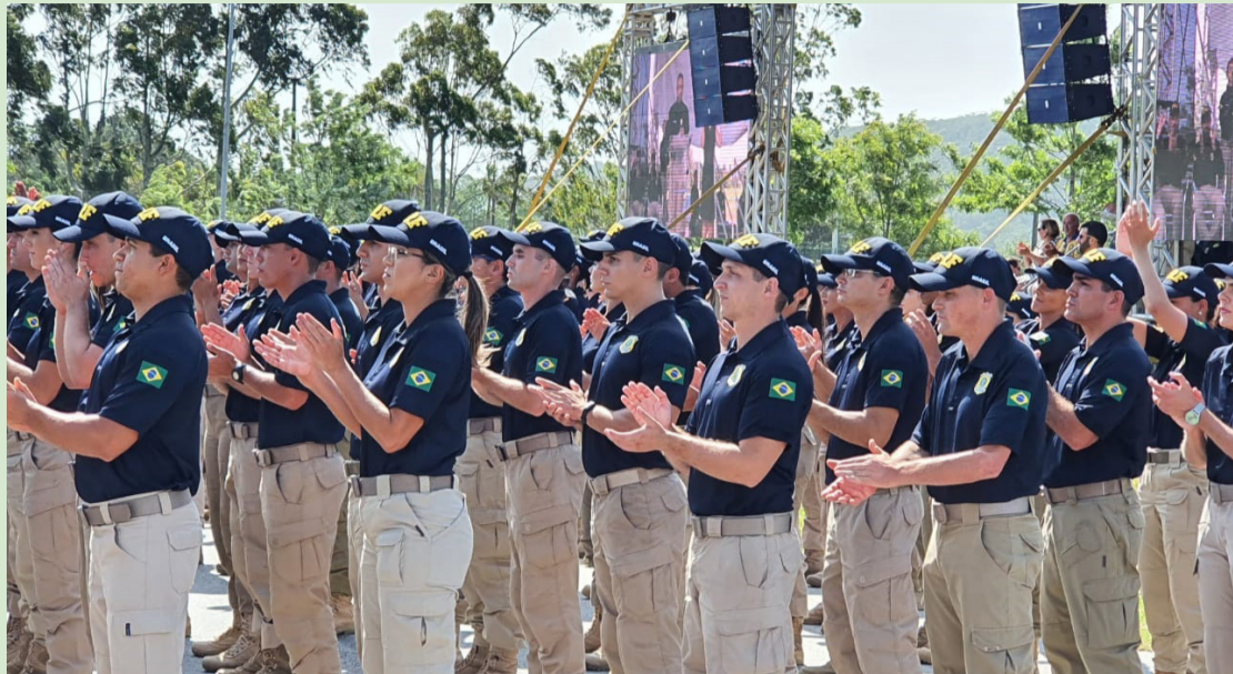
A FORMAÇÃO ALIA TEORIA E PRÁTICA PARA GARANTIR AGENTES APTOS A ATUAR COM EFICIÊNCIA E RESPEITO À LEGALIDADE

O ingresso na Polícia Rodoviária Federal (PRF) se dá por concurso público nacional, seguido de um rigoroso Curso de Formação Profissional (CFP), que prepara os policiais em legislação, direção defensiva, defesa pessoal, armamento, primeiros socorros, ética e direitos humanos. A formação alia teoria e prática para garantir agentes aptos a atuar com eficiência e respeito à