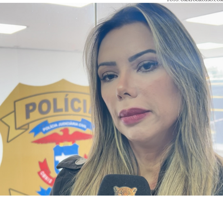
SEGUNDO DADOS DO MAPA DA SEGURANÇA PÚBLICA DE 2025, QUATRO MULHERES SÃO ASSASSINADAS POR DIA NO BRASIL.

E as pesquisas não mentem, os motivos sempre são os mesmos: a maior parte dos crimes ocorrem pelas mãos de ex-companheiros ou companheiros por ciúmes ou por não aceitarem o fim de relacionamentos. “[...] Todos os dias eu atendo mulheres aqui na Delegacia da Mulher retratando esse tipo de situação e que elas tomam decisões que os homens não adm-