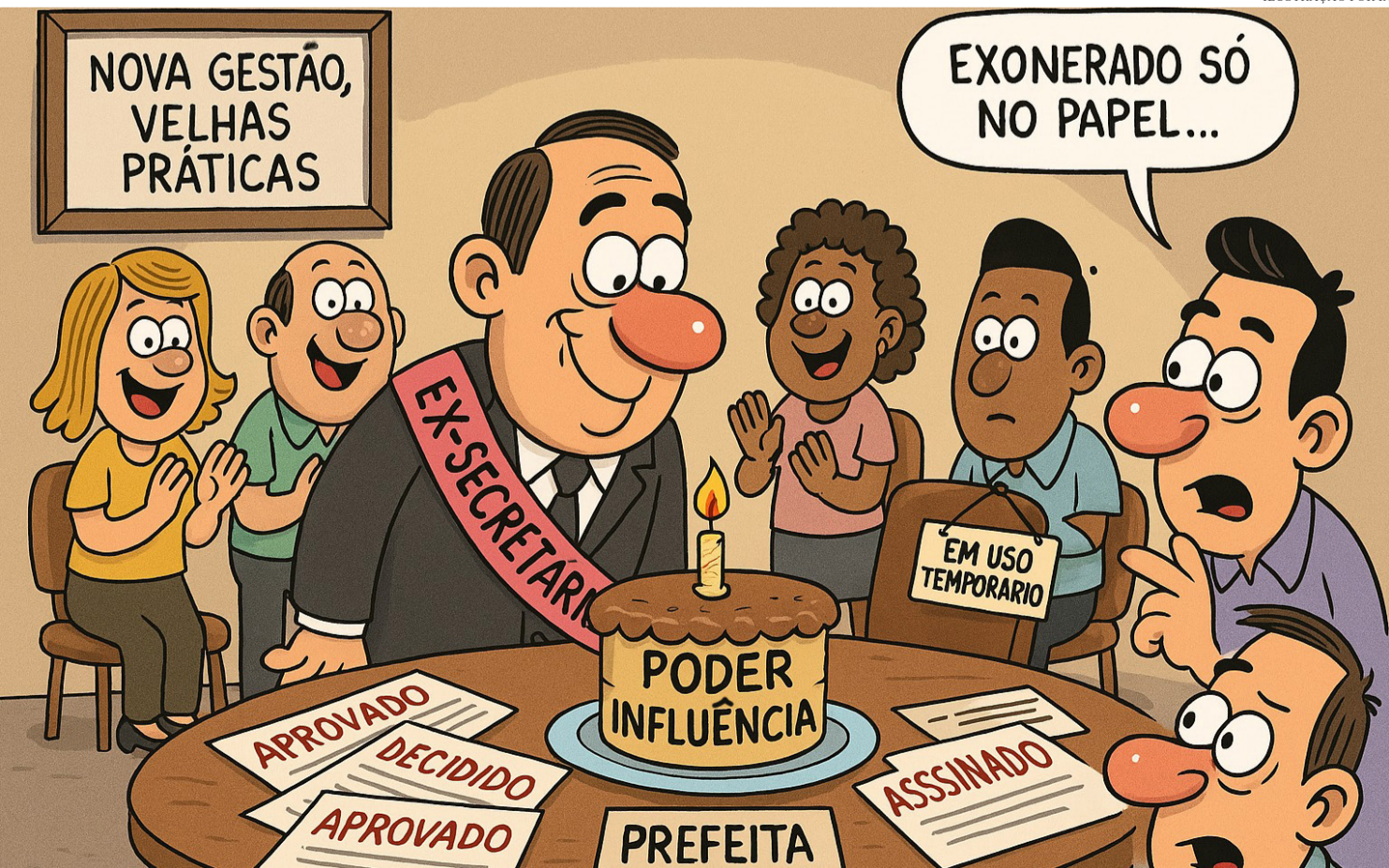
ILUSTRAÇÃO POR I.A.

*Os artigos são de responsabilidade de seus autores e não representam a opinião do O Mato Grosso.*