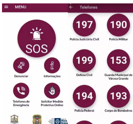
MATO GROSSO EMITIU MAIS DE 15 MIL MEDIDAS PROTETIVAS NO ANO DE 2024

S egundo o Conselho Nacional de Justiça (CNJ), Mato Grosso emitiu mais de 15 mil medidas protetivas no ano de 2024. Nos casos ocorridos neste ano, em pelo menos quatro deles haviam registros de violência doméstica anteriormente, mas apenas duas tinham medida protetiva. Elas denunciaram,