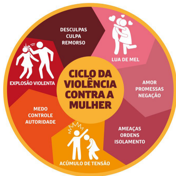
SAIBA COMO IDENTIFICAR AS TRÊS FASES DO CICLO E COMO ELE FUNCIONA

E le nasce no grito, no controle disfarçado de cuidado e no ciúmes disfarçado de carinho. O nome disso é ciclo da violência e ele é dividido em três fases, segundo a psicóloga norte-americana Lenore Walker: