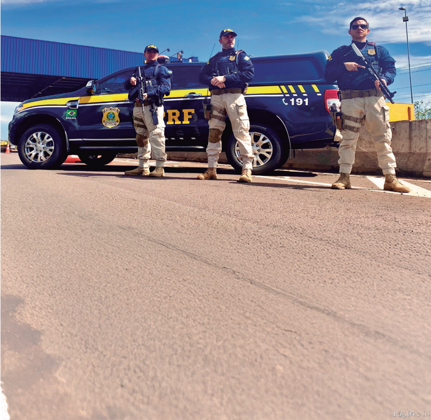
Pág.04 e 05

USO PRECOCE DE TELAS PODE CAUSAR DANOS IRREVERSÍVEIS EM CRIANÇAS