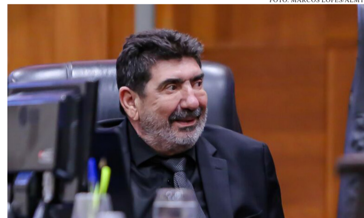
PL. DISPENSA CERTIDÕES E FIRMA RECONHECIDA PARA FACILITAR SERVIÇOS