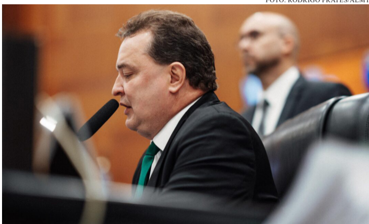
ENCONTRO REUNIU REPRESENTANTES DO PODER PÚBLICO, SETOR PRODUTIVO E COOPERATIVAS