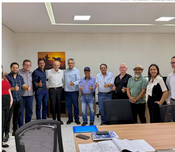
CERCA DE 195 FAMÍLIAS DO NOVO ARICÁ AÇÚ RECEBERÃO ESCRITURAS APÓS 25 ANOS DE ESPERA

Cerca de 195 famílias de chácaras da região do Novo Aricá Açú, localidade rural que abrange os municípios de Cuiabá e Santo Antônio de Leverger, estão prestes a receber a tão aguardada escritura de suas propriedades, após mais de duas décadas de espera. A entrega dos títulos foi definida durante uma reunião entre a equipe do deputado estadual Eduardo Botelho (União) e representantes do Instituto de Terras de Mato