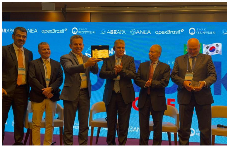
ESTADO É O MAIOR PRODUTOR DE ALGODÃO DO PAÍS, COM 70% DA PRODUÇÃO NACIONAL

O governador de Mato Grosso foi homenageado pela Associação Brasileira dos Produtores de Algodão (Abrapa) durante o evento “Cotton Brazil Outlook Korea”, realizado em Seul, na Coreia do Sul. A condecoração reconheceu o trabalho desenvolvido pelo Estado na promoção da cultura do algodão e na ampliação de mercados internacionais para o setor.