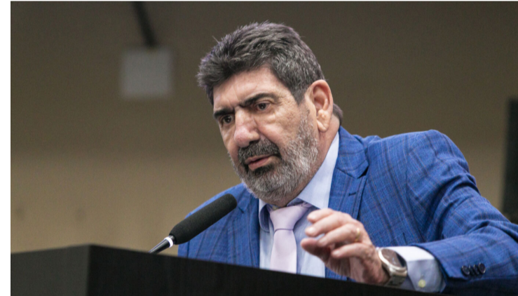
PROJETO PERMITE QUE EMPRESAS UTILIZEM ESSES CRÉDITOS PARA QUITAR DÉBITOS FISCAIS E FACILITA TRANSFERÊNCIAS PARA OUTROS CONTRIBUÍNTES