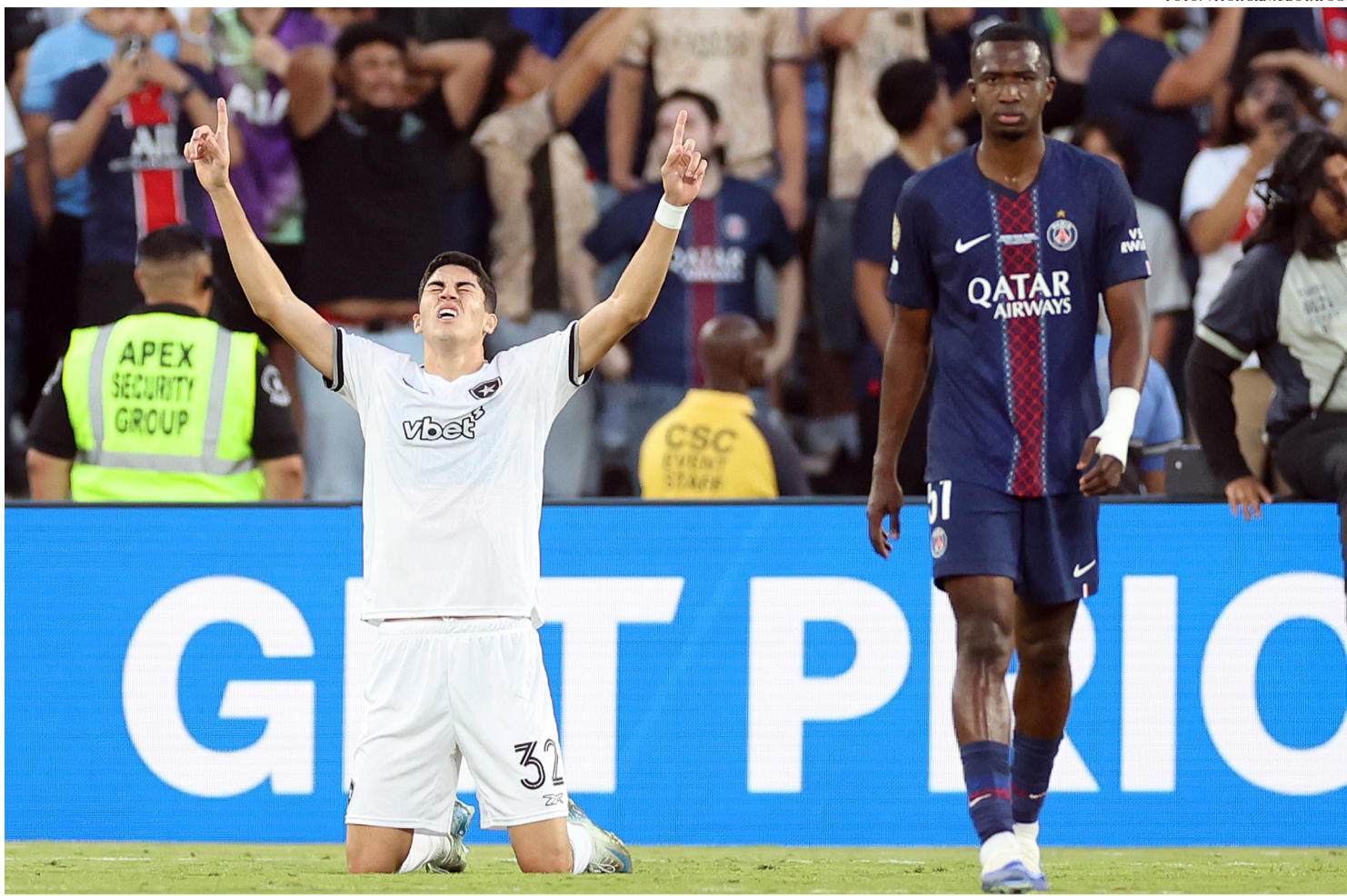
BOTAFOGO VENCEU O PSG, ATUAL CAMPEÃO DA CHAMPIONS, POR 1 A 0 NO ROSE BOWL

Neste mundial, os times brasileiros não só chegaram como chegaram destruindo. Contra todas as análises e perspectivas, inclusive as minhas, admito. Esquece aquele velho roteiro de “quase deu”, de time sul-americano chegando para ser figurante. Dessa vez, o roteiro é outro. Os clubes brasileiros estão fazendo frente (e até passando por cima)