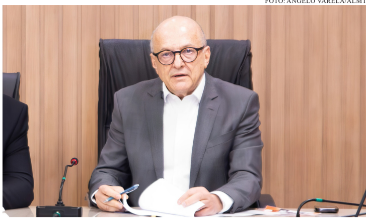
A PROPOSTA, ENTREGUE PESSOALMENTE PELO GOVERNADOR EM EXERCÍCIO, OTAVIANO PIVETTA (REPUBLICANOS), BUSCA CORRIGIR DISTORÇÕES E PROTEGER OS SERVIDORES

O Governo de Mato Grosso apresentou à Assembleia Legislativa um projeto de lei que estabelece novas regras para as operações de crédito consignado destinadas aos servidores públicos estaduais. A proposta, entregue pessoalmente pelo governador em exercício, Otaviano Pivetta (Republicanos), busca corrigir distorções e proteger os servidores contra abusos e superendividamento.