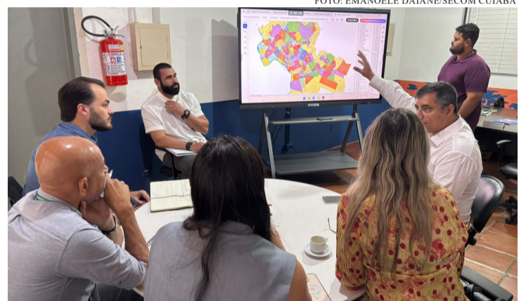
DEFESA CIVIL DEFINE AÇÕES COM SECRETARIAS PARA COMBATER QUEIMADAS NA CAPITAL

A integração entre os órgãos municipais tem sido fundamental para o fortalecimento das ações de prevenção às queimadas em Cuiabá. Com foco na atuação coordenada, a Secretaria de Defesa Civil do município tem liderado reuniões estratégicas com representantes da Secretaria Municipal de Ordem Pública (SMOP) e da Secretaria de Meio Ambiente e Desenvolvimento Urbano para alinhar o andamento do projeto “Cuiabá sem Queimadas” , uma iniciativa conjunta entre a Prefeitura e o Corpo de Bombeiros. As estratégias do projeto priorizam as regiões Sul e Oeste da capital, áreas que, historicamente, concentram os maiores índices de focos de calor. A Secretaria de Ordem Pública assume a responsabilidade de fiscalizar e notificar proprietários de terrenos urbanos, exigindo a limpeza regular de lotes e calçadas, medida essencial para evitar a propagação de incêndios