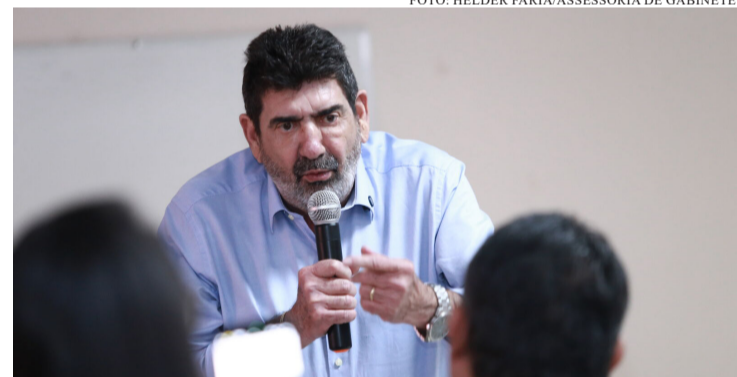
A COMISSÃO DE SAÚDE PLANEJA PACTUAÇÕES DE CURTO, MÉDIO E LONGO PRAZO, PRIORIZANDO A SUSTENTABILIDADE DO SISTEMA