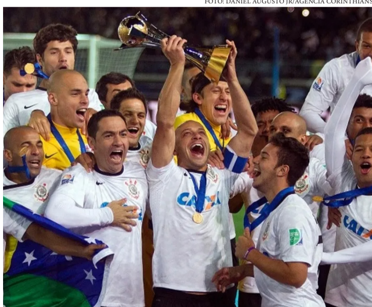
CORINTHIANS FOI O ÚLTIMO TIME BRASILEIRO A CONQUISTAR O TÍTULO DO MUNDIAL DE CLUBES EM 2012

Todo Mundial serve pra gente lembrar de um fato que o torcedor brasileiro tenta esquecer entre calendário inchado e demissão precoce de técnico: o futebol europeu não está só na frente, está em outra galáxia.