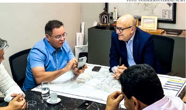
DEPUTADO EDUARDO BOTELHO ARTICULA R$ 2 MILHÕES PARA REFORMA DO PRÉDIO QUE ABRIGARÁ A CÂMARA MUNICIPAL DE VG

O fortalecimento institucional da Câmara Municipal de Várzea Grande ganhou um novo capítulo com a confirmação de um investimento de R$ 2 milhões para a reforma da futura sede do Legislativo. O recurso foi assegurado por articulação direta do deputado estadual Eduardo Botelho (União Brasil) , que liderou tratativas junto ao Executivo Estadual, consolidando um compromisso para modernização da estrutura pública. A reunião decisiva ocorreu no Palácio Paiaguás, em encontro com o governador em exercício de Mato Grosso, Otaviano Pivetta