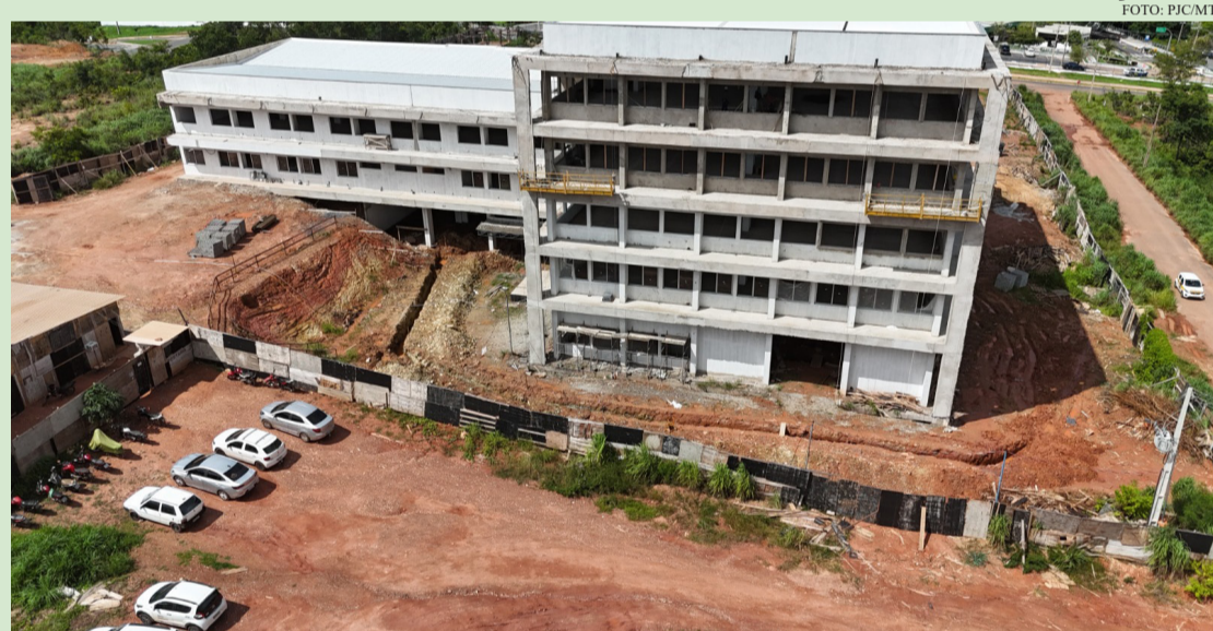
A POLÍCIA CIVIL RECEBEU EM CONTA PRÓPRIA RECURSO DE R$ 30 MILHÕES PARA CONSTRUÇÃO DE NOVA SEDE

Com foco na modernização da segurança pública, a Polícia Civil de Mato Grosso recebeu investimentos para estruturação de delegacias na região metropolitana e interior do Estado, provenientes do Governo Estadual, prefeituras, Ministério Público e Conselhos Comunitários de Segurança (Conseg's). Entre os principais avanços estão duas novas delegacias , entregues em Matupá (março) e Campo Novo do Parecis (julho), seguindo o novo padrão institucional. Além disso, foram instaladas nove salas especializadas de atendimento a vítimas de violência doméstica e grupos vulneráveis em Campo Novo do Parecis, Cocalinho, Juína, Matupá, Porto Alegre do Norte, Peixoto de Azevedo, Santa Terezinha, Sorriso e Vera . Oito projetos de novas unidades estão em andamento: Rosário Oeste, Nobres, Campo Verde, Guarantã do Norte, Roubos e Furtos de Rondonópolis, Delegacia de Defesa da