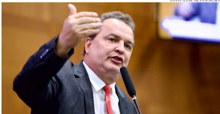
A ALMT APROVOU, EM SEGUNDA VOTAÇÃO, UMA LEGISLAÇÃO IMPORTANTE PARA O FUNCIONALISMO PÚBLICO ESTADUAL