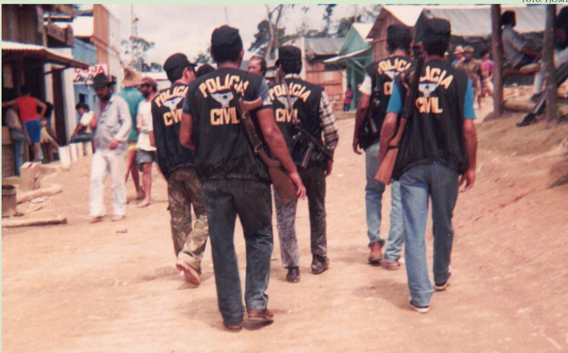
O PRIMEIRO CONCURSO PÚBLICO PARA DELEGADOS, ESCRIVÃES E AGENTES FOI REALIZADO EM 1985

A virada histórica aconteceu em 1984, quando foi aprovada a Lei nº 4.721, que criou a Polícia Civil de carreira. O primeiro concurso público para delegados, escrivães e agentes foi realizado em 1985. A partir daí, a instituição ganhou autonomia, estrutura própria e passou a atuar com base em critérios técnicos. Em 1992, a Lei Complementar nº 20 reformulou o