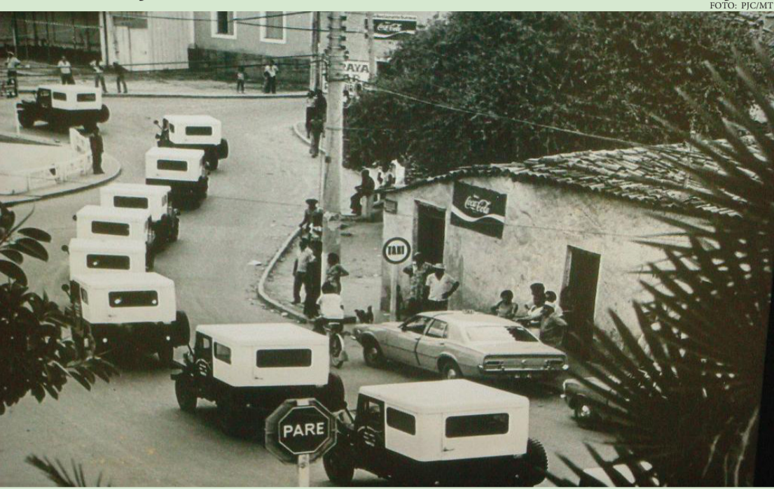
A POLÍCIA CIVIL FOI OFICIALMENTE CRIADA EM MATO GROSSO EM 24 DE MAIO DE 1842

A história da Polícia Judiciária Civil está ligada ao desenvolvimento das civilizações e à necessidade de manter a ordem pública. Desde o Egito, Grécia e Roma antigas, já havia práticas de vigilância, repressão e julgamento. O conceito moderno de polícia, no entanto, tomou forma no século XVIII, na França, com a separação entre polícia administrativa e polícia judiciária , esta voltada à investigação criminal. Em Portugal, autoridades como alcaides e quadri-lheiros exerciam funções policiais. Esse modelo foi trazido para o Brasil Colônia. Em Mato Grosso, os primeiros registros datam de 1753, com a criação de uma companhia de ordenança. Em 1835, surgiu o Homem do Mato , figura encarregada de patrulhar áreas rurais e capturar criminosos. A Polícia Civil foi oficial-